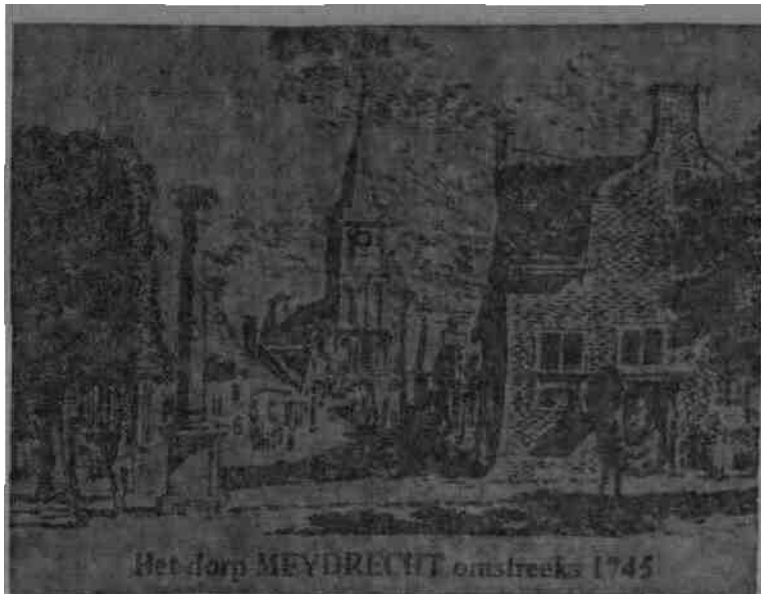
Het dorp MEYDRECHT omstreeks 1745

Uitgave van de historische vereniging De Proostdijlanden (Mijdrecht, Vinkeveen, Waverveen en Wilnis)