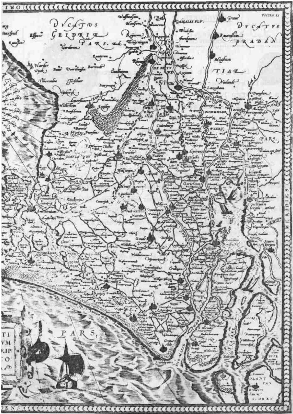
Deze kaart is een verkleining van een nieuwe kaart die in 1537 door Jacob van Deventer werd gemaakt in opdracht van de Staten van Holland. De verkleining werd in de eerste systematische kaartverzameling opgenomen welke als boek in 1570 te Antwerpen werd uitgegeven onder de titel Theatrum orbis terrarum .