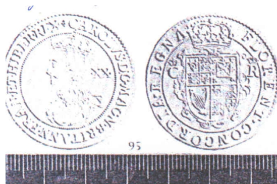
Voor- en achterzijde zegel Karel I