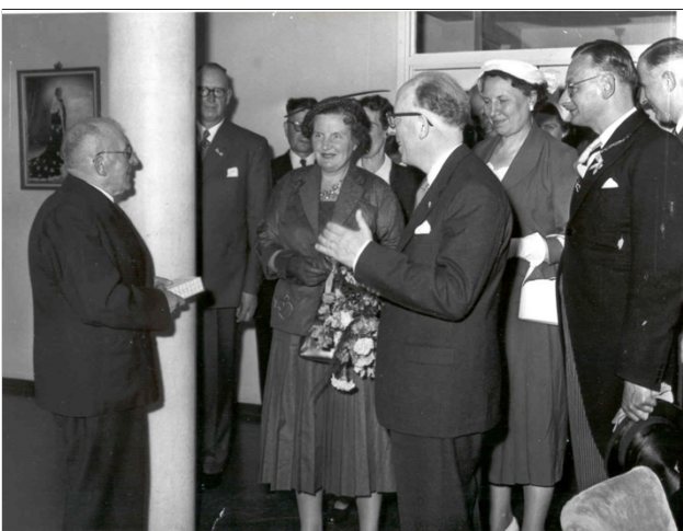
De Koningin in huize Nieuw Avondlicht

Omstreeks 16:15 uur vertrok de Koningin c.s. richting Waverveen.