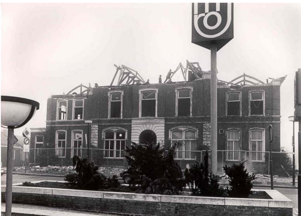
Voormalig gemeentehuis te Mijdrecht onder slopershamer

Geraadpleegde archieven: Streekarchief Vecht en Venen: gemeentearchief en raadsnotulen gemeente Mijdrecht