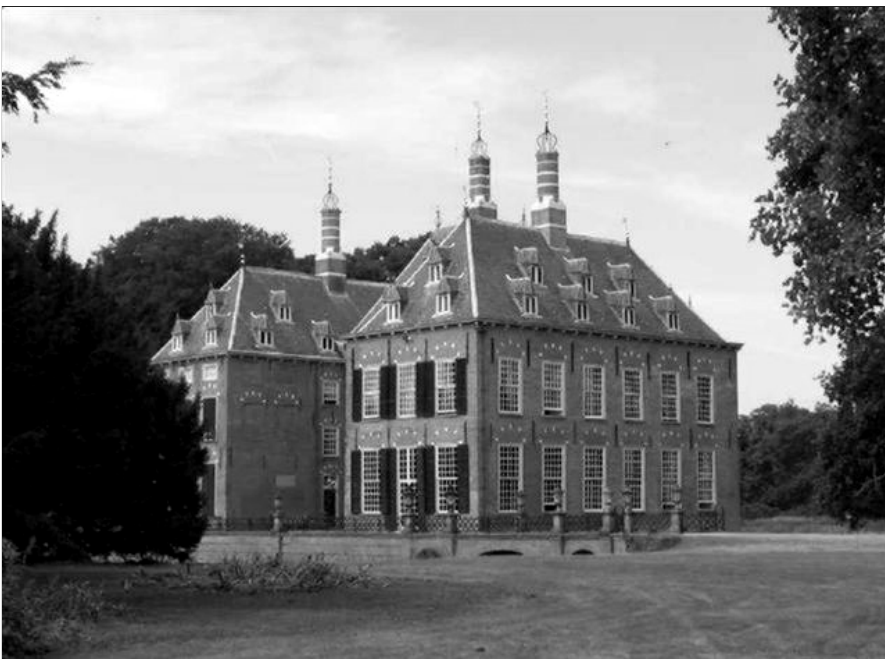
Kasteel Duivenvoorde bij Voorschoten

E.A. Canneman en L.J. van der Klooster. De Geschiedenis van het kasteel Duivenvoorde en zijn bewoners.