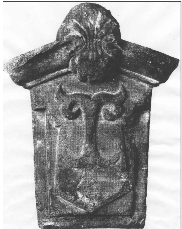
Uit het Proostenhuis?