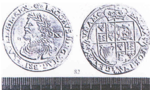
Voor- en achterzijde zegel Jacobus I

Het is niet verwonderlijk dat een Hollander deze munten hier in zijn bezit had omdat ze in Europa veel in omloop waren. En ook niet dat de munten op een veilige opbergplaats onder de grond werden verborgen, want zij hadden toen een behoorlijke waarde. Volgens verschillende plakaten uit die tijd werd de koers, die de andere munten in ons land mochten hebben, officieel geregeld. Een plakkaat uit 1643 stelt de munt van Karel I op 11 gulden en 10 stuivers, dezelfde waarde als die van Jacobus. Gedurende de 16 e en 17 e eeuw was het internationale betalingsverkeer nog weinig ontwikkeld. Deviezencontrôle aan de grenzen ontbrak, ook al omdat er geen officiële grenzen waren vastgesteld. Daarom was het zenden van baar geld een algemeen gebruik. Het op deze wijze binnengekomen vreemde geld, vooral gouden munten, werd in betaling aangenomen omdat het voor verzending en betaling naar het buitenland bruikbaar was. Men moest wel van de van overheidswege bekend gemaakte koersen op de hoogte zijn. In ons land werd vooral goud geld ontvangen van de landen waarmee we nauwe handelsbetrekkingen hadden, zoals de Zuidelijke Nederlanden, Frankrijk Engeland, Spanje, Portugal en de Scandinavische landen.