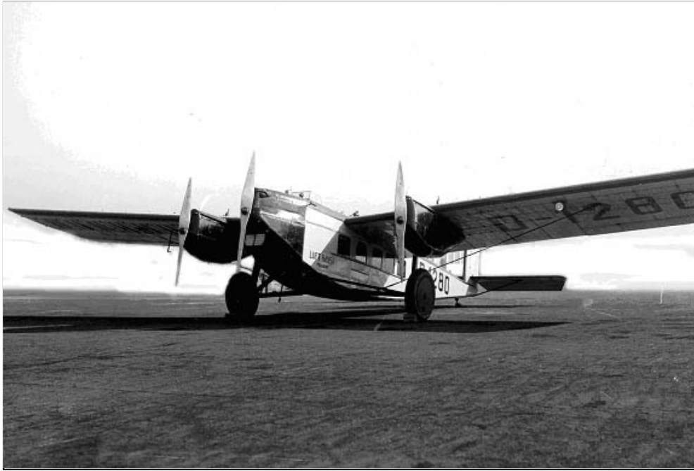
Bij gebrek aan een foto van de Rohrbach Roland I D-1314 'Inselberg' is hier een identiek toestel afgebeeld, namelijk de Rohrbach Roland I D-1280 'Feldberg'. Het eerste prototype van de Roland I vloog in 1927. De 'Inselberg' is van 1928 tot en met 1934 bij de 'Luft Hansa' in dienst geweest en heeft daarna nog een aantal jaren in Oost-Europa en Rusland gevlogen.