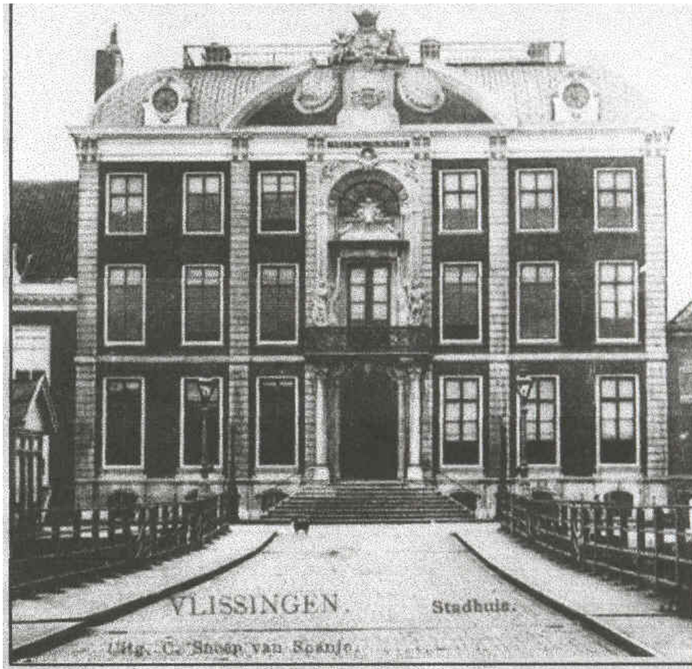
Vlissingen: Van Dishoeckhuis