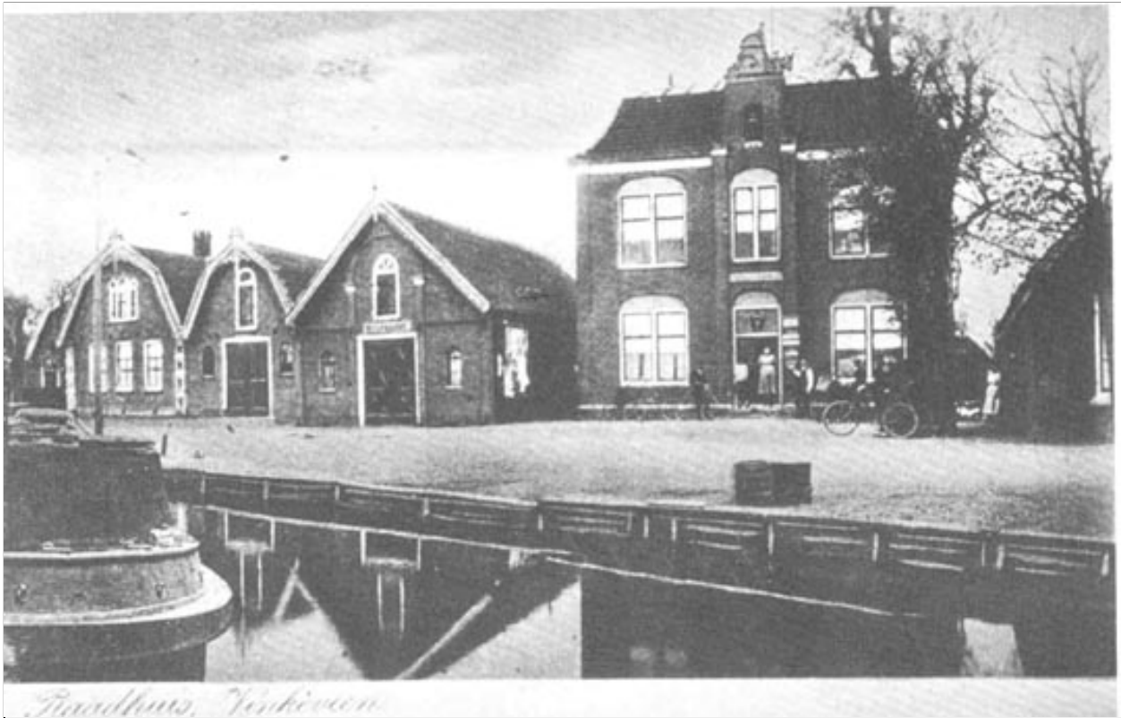
Huisnummer V7 “op de plek waar nu het autobedrijf zit”. Die zit nu drie huizen links van het op deze foto getoonde voormalige gemeentehuis. De foto dateert van de tijd toen Van Rijnsoever nog beurtschipper was. De juiste datum is onbekend