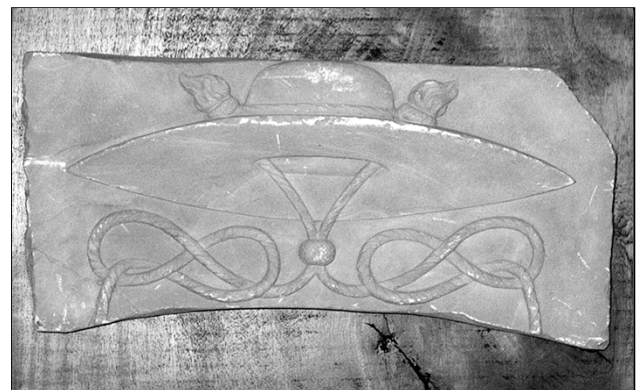
De gipsen replica van de beschreven gevelsteen

"De beeldhouwde steen welke u tot nader onderzoek bij ons achterliet, heeft kennelijk onderdeel uitgemaakt van een heraldisch ornament, eertijds aangebracht in de gevel van een de. r.k. geestelijkheid toebehorend bouwwerk. De voorstelling op de onderhavige steen stelt namelijk een kardinaalshoed voor, welk embleem slechts die huizen mochten voeren, waarin een kardinaal verblijf gehouden had, dan wel die gebouwen welke een kardinaal ter beschikking stonden. Aangezien het bisdom Utrecht hoogst zelden een kardinaal heeft opgeleverd, en zeker niet in het tijdperk, waaruit de steen ons inziens dateert, tweede helft 16 e of eerste helft 17 e eeuw, blijft de vondst vooralsnog een raadsel. Wel kan men het vermoeden uiten, dat de steen iets te maken heeft met de proosdij van