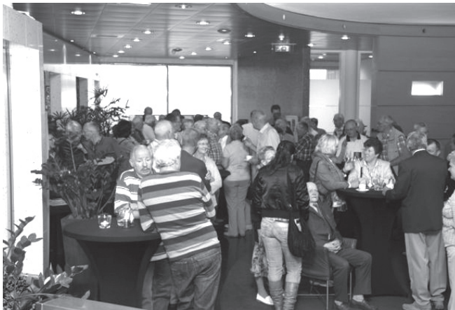
Er was veel belangstelling op de presentatie van de dvd