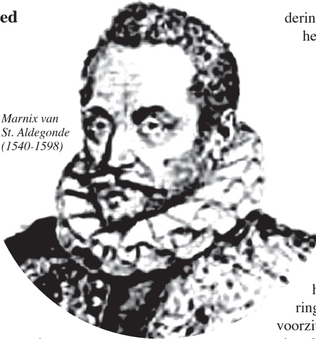
Marnix van St. Aldegonde (1540-1598)