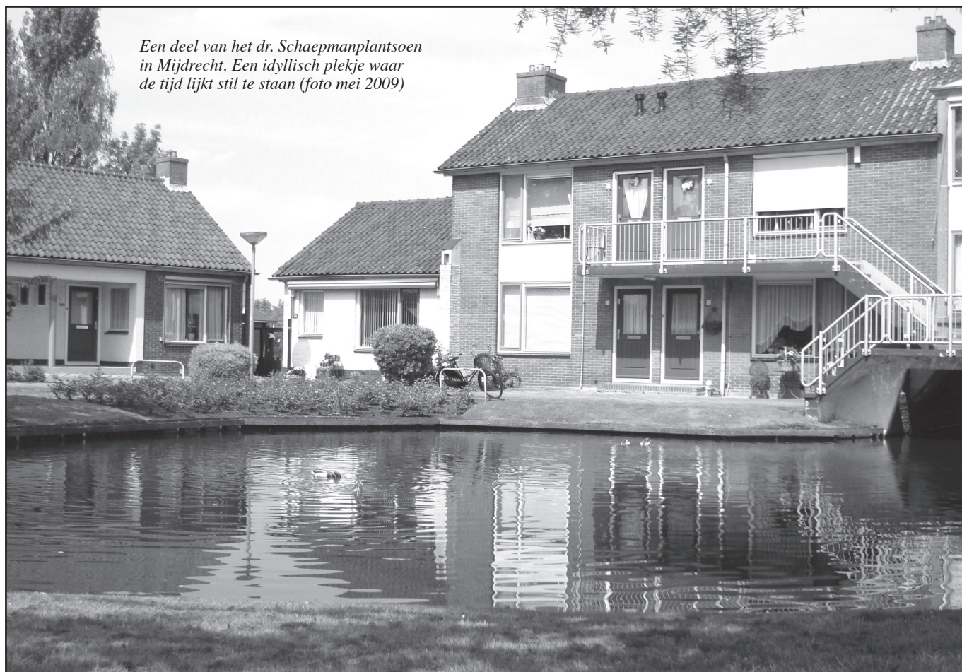
Een deel van het dr. Schaepmanplantsoen in Mijdrecht. Een idyllisch plekje waar de tijd lijkt stil te staan (foto mei 2009)