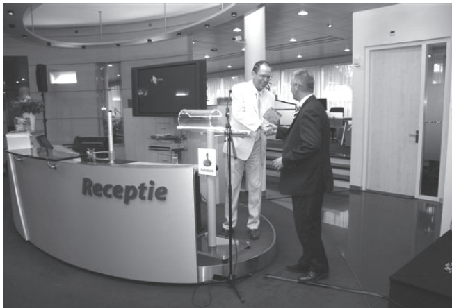
Overhandiging dvd aan sponsor Rabobank

Onze vereniging bestaat vijftientig jaar. In het kader van dit jubileum organiseren we dit jaar diverse activiteiten. We vinden het belangrijk dat we voor zoveel mogelijk leden een aantrekkelijk programma of begerenswaardige publicaties bieden. U kunt hiervan deelgenoot zijn, maar nog leuker vinden we het als u uw enthousiasme deelt met anderen en aan zoveel mogelijk anderen doorvertelt wat we allemaal bieden.