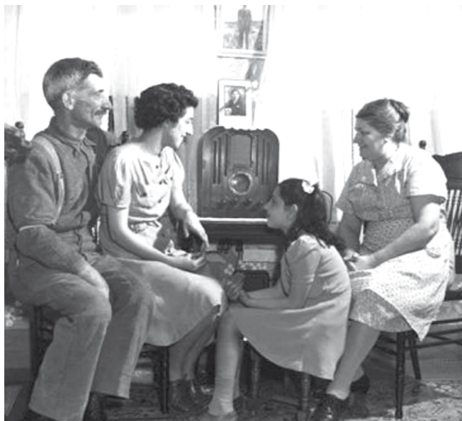
Stiekem naar de Engelse zenders luisteren.

Direct naar de bevrijding is "De Lord" door de ondergrondse opgepakt en uiteindelijk is hij voor verschillende feiten tot een gevangenisstraf veroordeeld.