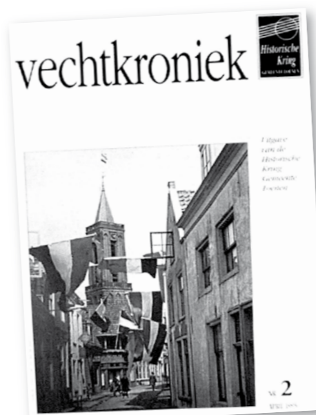
De Vechtkroniek is het tijdschrift van de Historische Kring Gemeente Loenen.

En als dit alles nog niet genoeg is zijn er op de startpagina nog vele tientallen dochterpagina's van Anne Frank tot en met de Zijderoute. Hiertussen ook de zoekmogelijkheid in historische kranten. U tikt bijvoorbeeld uw familienaam in het zoekvenster van het Utrechts Nieuwsblad of de Laarder Bel en warempel u treft berichten over familieleden in het verleden. Heel grappig. Zo heeft u natuurlijk een uitstekende mogelijkheid om uw eigen familiegeschiedenis nog eens te herbeleven.