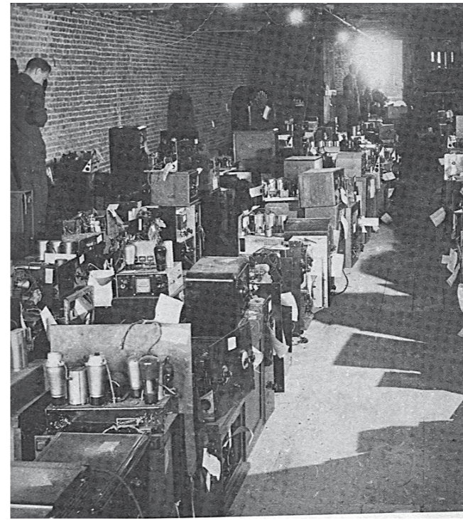
In beslag genomen radio's.

Per 1 januari 1941 werd het "luistergeld" ingevoerd. Er moest worden betaald voor de ontvangst van radioprogramma's. Men kreeg dan een luistervergunning en op deze wijze werd bij de PTT een cartotheek van radiobezitters samengesteld. Die cartotheek was alfabetisch op naam samengesteld en niet op woonplaats. Men kon dus niet zien wie in onze gemeente een radio bezat. Dit maakte de controle om na te gaan of de radio was ingeleverd er niet gemakkelijker op. Een ander probleem betrof de radio-antenne. De toestellen van toen hadden voor ontvangst van de zenders een buitenantenne nodig. Die antenne kon je verraden en moest dus weggehaald worden. Maar sommigen bezaten nog een oud toestel. Mijn vader had nog een zelf gemaakt radiotoestel met honingraatspoelen uit de jaren twintig van de vorige eeuw. Dit