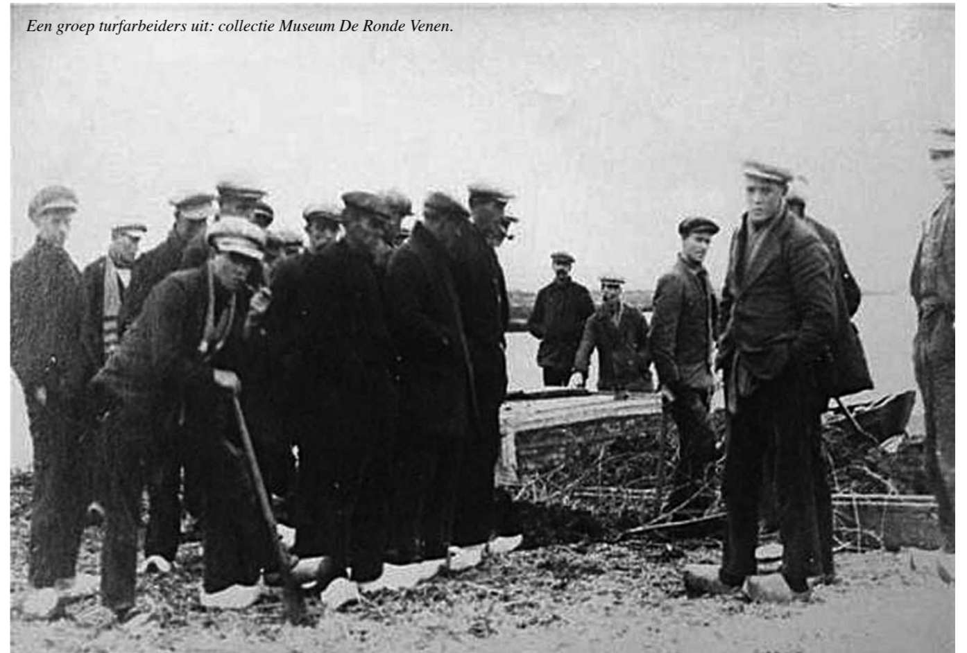
Een groep turfarbeiders uit: collectie Museum De Ronde Venen.

vierkante roede. Per week nam de turfmaker een bepaald bedrag op, een soort voorschot. Aan het einde van het seizoen werd dit verrekend met wat er daad- werkelijk was verdiend en kreeg de arbeider de rest uitbetaald. Hoe een turfmaker zijn tijd indeelde, was zijn eigen verantwoordelijkheid.