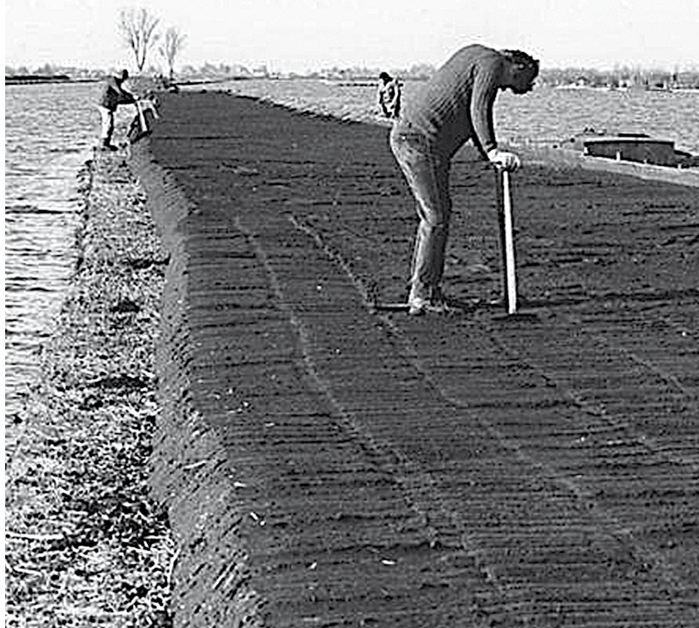
Turfmakers tijdens het vasttrappen van het veenslik uit: collectie Museum De Ronde Venen.