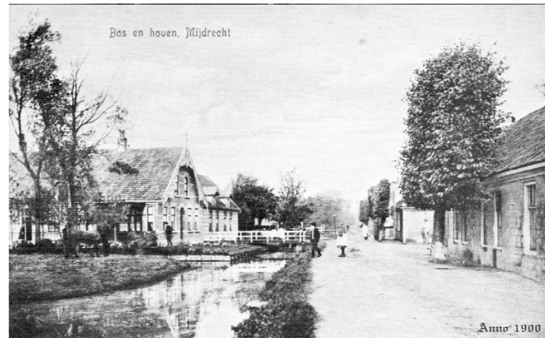
Eén van de foto's die op het gemeentehuis werd ingeleverd.