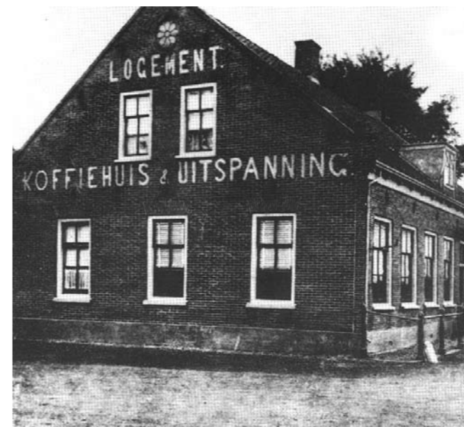
Zelfs de uitgever van ansichtkaarten gaf aan dat de Mennonietenbuurt bij Uithoorn hoorde.

Inderdaad is dit door druk van de bezetter in enige gevallen gebeurd. Op 23 april 1941 zijn namelijk de toenmalige gemeenten Abcoude, Abcoude Baambrugge en Abcoude Proosdij tot de nieuwe gemeente Abcoude samengevoegd. De Duitsers hadden namelijk weinig op met zeer kleine gemeenten waar de burge-