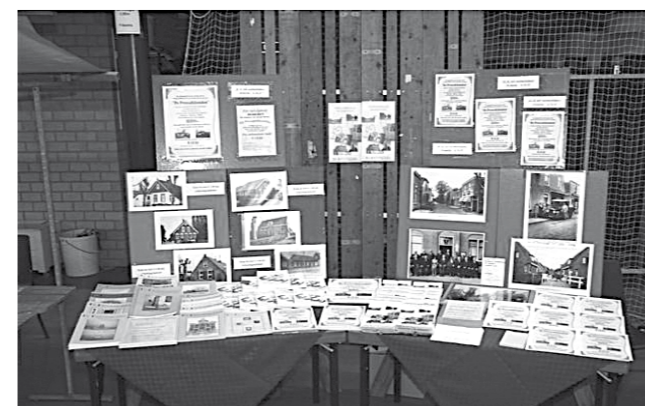
De Historische Vereniging presenteert zichzelf.

De inrichting neemt nog wat langer tijd in beslag. In het voorjaar, om precies te zijn 28 mei a.s. (16.00 uur), willen we u in de gelegenheid stellen om een soort van officiële opening mee te maken. Tot die tijd zijn een aantal harde werkers nog druk met het inrichten van de vergaderruimte, het documentatiecentrum, de werkplaatsen voor de werkgroepen en de opslagruimtes. Dit alles in de aanloop naar een meer definitieve verenigingsruimte, die we in het nieuw te bouwen Paviljoen hopen te kunnen gaan gebruiken.