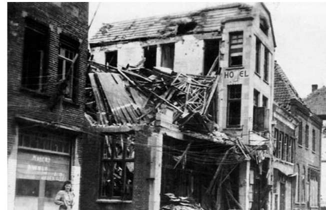
Zo troffen de geëvacueerden na hun terugkomst hun woning aan.

Als dan het bevel voor de evacuatie komt worden allerlei voertuigen ingezet, zoals kindrewagens, bolderwagens en karretjes op wielen. Zeker niet te vergeten, de fiets op echte "volbanden" (rubber