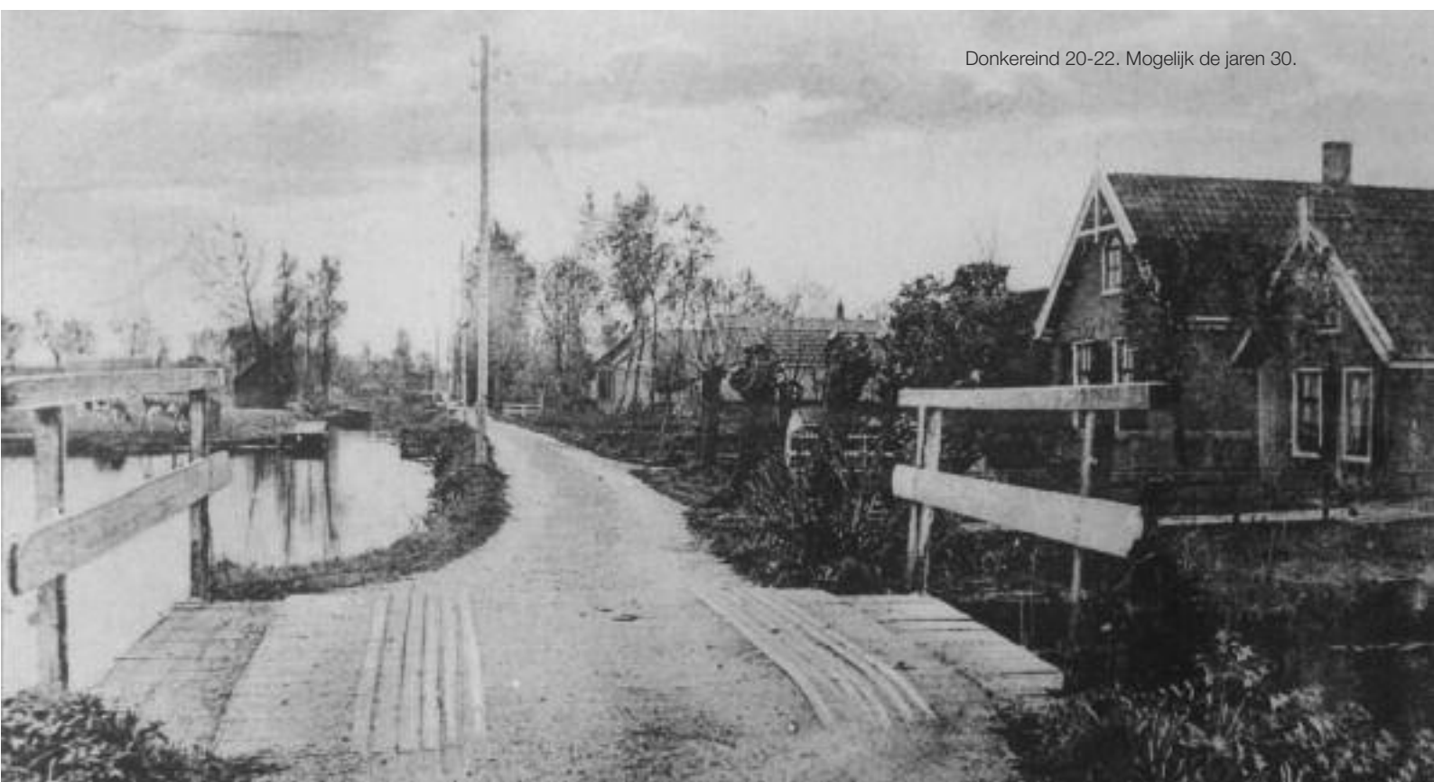
Donkereind 20-22. Mogelijk de jaren 30.