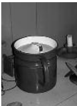
De melkkoker waarin de melk werd gekookt

De melk moest altijd door de koper gekookt worden om ziekten te voorkomen en om te voorkomen dat de melk zuur werd. Nadat men de volle melk in een melkkan met een speciaal deksel gekookt had, lag er een groot vel van dikke room op de melk. Sommige mensen vonden zo'n vel, losgeklopt met suiker, heerlijk, maar de meesten lustten dat niet. Later werd de melk alleen nog in flessen verkocht en verdween de melkboer met zijn kar uit het straatbeeld.