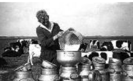
Dit zie je niet meer op de weilanden gebeuren

Met het lezen van dit krantenartikel zullen onze lezers zich wellicht afvragen hoe dit allemaal kon gebeuren. Het zal nu niet meer voorkomen dat iemand midden in de nacht de koe van een boer in de wei gaat melken om zelf op te drinken of pap van te koken. Een pak melk stelen bij de supermarkt ligt meer voor de hand. De wegen zijn tegenwoordig meestal verlicht, waardoor iemand gemakkelijk opvalt als hij midden in de nacht in de wei tussen de koeien zit. Bovendien gebeurt het melken van de koeien nu machinaal. Deze dieven zouden wij kruimeldieven noemen. Gestolen wasgoed is tegenwoordig voor een dief niet meer interessant, want als je wilt stelen, dan kun je in de winkel je eigen maat uitzoeken. Dieven en overtredders van de wet worden nu evenmin bij de burgemeester voorgeleid. Sommige burgemeesters zouden daar dan een dagtaak aan hebben. Dit verhaal in de krant kunnen wij alleen maar begrijpen als we in onze gedachten teruggaan naar de tijd van toen. Graag had ik de lezers op de hoogte willen stellen van de straf die de dieven hebben gekregen en of er nog meer feiten boven water gekomen zijn. Maar daarvoor moet onderzoek gedaan worden bij het gerecht in Utrecht. Bovendien zijn de volledige namen van de dieven niet bekend en moeten er heel veel dossiers worden doorgenomen die combineren met dit krantenverslag. Daar is de schrijver van dit artikel (nog) niet aan toegekomen.