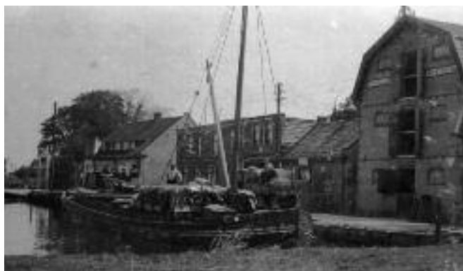
Het kleine huisje naast de graansilo van Engel deed lange tijd dienst als gevangenis

Overdag was de handhaving van wettelijke orde in handen van de veldwachter. In de biografie "Van voorbijgegane Jaren" van Hein Zuidervaart wordt hij geportretteerd als een strenge lange man, gestoken in een pak met koperen knopen en de sabel met koperen handvat op de heup. Als teken van waardigheid had hij een flesje met inkt met een touwtje vastgemaakt aan één van de knopen van zijn uniform en de pen zat achter het oor. Die had hij soms nodig om de biljetten voor voldaan te tekenen na ontvangst van belastingpenningen. Omdat hij toch zijn ronde moest maken, bespaarde de veldwachter de belastingplichtigen een hele tippel. Het muntstukje dat hij dan voor zijn diensten kreeg was een leuke bijverdiensite. Bij overtredingen kon hij je streng toespreken, maar een aangereikte sigaar om de boel te sussen deed wonderen. Men hoorde hem wel eens klagen dat hij weinig te doen had, maar wanneer men hem wel nodig had, was hij of onderweg naar Blokland of naar het gemeentehuis in Mijdrecht. Het praatje ging, dat als hij eenmaal naar bed was gegaan hij er voor niets ter wereld uit zou komen. Maar dat was zelden nodig, want de criminele activiteiten bleven beperkt tot een late, lallende cafébezoeker, die zonder tegenstribbelen met de nachtwacht mee strompelde in de vaste overtuiging dat die hem naar een veilige plek zou begeleiden. En hij werd niet teleurgesteld want in de bajes - vooraan in de Mennonietenbuurt - zou hij de andere morgen tezamen met zijn kater ontwaken.