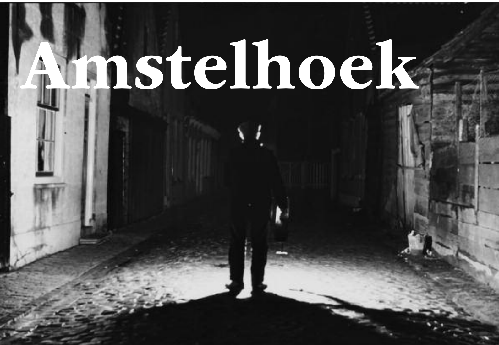
De nachtwacht tijdens zijn ronde

kwart voor tien moest men zich melden in het hoofd wachthok waar vier wachten achterbleven voor - zo nodig - latere assistentie. Twee man liepen vanuit het wachthok richting Driehuis en de andere twee gingen op weg naar Demmerik, tot aan de boerderij van Evert de Vos. Zo werd er tot vier uur 's morgens bij toerbeurt gewisseld. In het lijvige reglement werd echter met geen woord gerept over enige financiële genoegdoening. Daarentegen logen de boetes er niet om wat betreft enig plichtsverzuim, zoals blijkt uit - kort samengevat - artikel 14: "(...) en die zich onder de wachttijd dronken drinkt; onordentelijk gedraagt; de patrouilles niet geheel volbrengt; zich in huis begeeft; brutaal is tegen den officier; zijn orders ongehoorzaam is te volbrengen of in eenig ander opzicht iets miszeft of misdoet, voor elke zodanige overtreding zal worden verbeurd drie guldens." Daarentegen kon de dienstdoende officier bij plichtsverzuim bestraft worden, op poene van twee gouden dukaten.