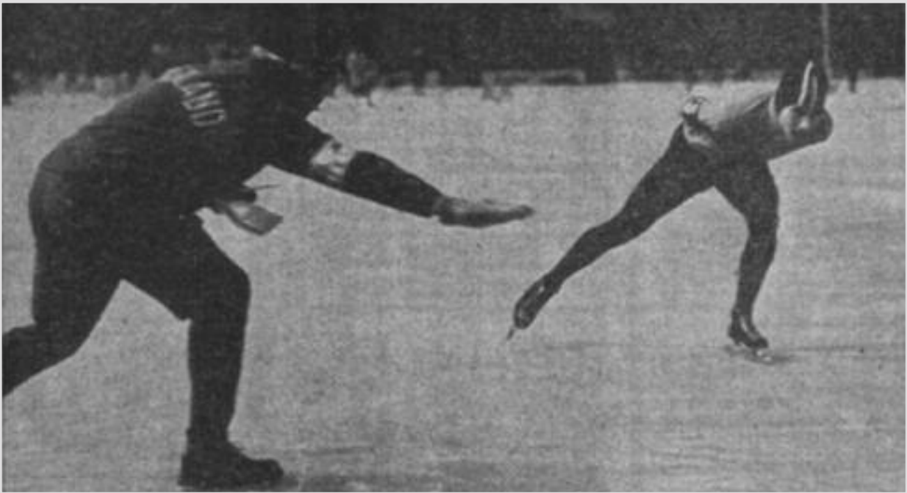
'Nederland doet wereld versteld staan in Oslo', Friese Koerier (13-02-1967)

in verschillende media. De natuur gooide echter roet in het eten. De ijsdikte bleek over de gehele route onvoldoende en de intredende dooi maakte een einde aan de Elfstedenkoorts. De politieke, religieuze en culturele discussies, die naar aanleiding van deze mogelijke Elfsteden-tocht werden gevoerd, vroegen om een historische uitleg. Waar kwam deze Elfstedenkoorts vandaan en welke rol speelde de Nederlandse schaatscultuur in de samenleving?