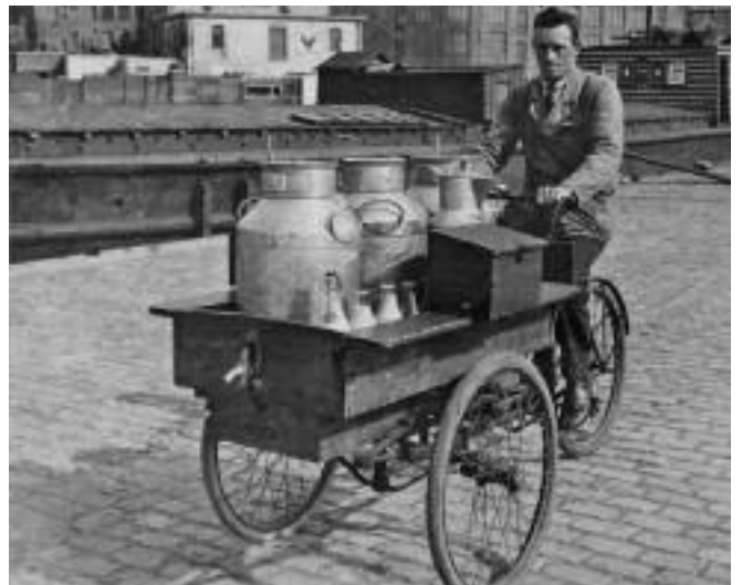
De melkboer op weg naar zijn klanten

Op de Gelderse kade in Amsterdam was een firma die miljoenen glazen flessen importeerde en doorverkocht aan de melkfabrieken. 'Melk' werd soms ook als een lekkernij beschouwd. Als je als kind bij oma en opa, of oom en tante op visite kwam en je gevraagd werd wat je wilde drinken, kon je vaak kiezen tussen een glas melk of limonade. Magere meisjes of jongens konden niet kiezen, die kregen meestal melk, want dat was gezond.