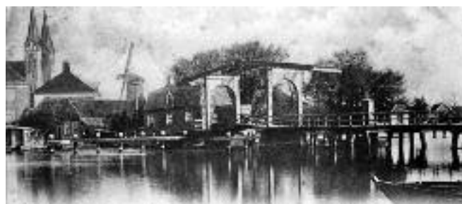
Voorloper Irenebrug Uithoorn

De nijverheidsschool Arbeid Adelt wordt, v.w.b. de dagschool, bezocht door zo'n 90 leerlingen waarvan 20 uit Uithoorn. Er is met de luchtbeschermingsdienst geen gemeenschappelijke regeling, wel is er samenwerking met de diensten in Mijdrecht en Uithoorn. Dit geldt ook voor de brandweer. Algemene uitreiking van distributiekaarten gebeurt op meerdere plaatsten in de gemeente, waaronder de Mennonietenbuurt. Daar is ook een stembureau. De belangen van het bedoelde deel van de gemeente worden naar behoren behartigd. Meer dan 40 jaar woont een der wethouders in het bedoelde gedeelte, terwijl het ook is voorgekomen dat beide wethouders daar woonden. De Amstel is de natuurlijke grens tussen twee gemeenten en twee provincies. “Wij meenen met vorenstaande te hebben aangetoond, dat er geen aanleiding bestaat aan het verzoek tot grenswijziging te voldoen. Wij merken voorts op dat er ook nog 265 adhesiebetuigingen zijn gesteld door 125 gezinshoofden. Deze handtekeningen werden verzameld nadat een actie tegen de beoogde grenswijziging werd ingezet. Het gedeelte der gemeente bovenbedoeld heeft 1325 inwoners, de gehele gemeente telt 4700 inwoners”. Wg. Padmos, burgemeester.