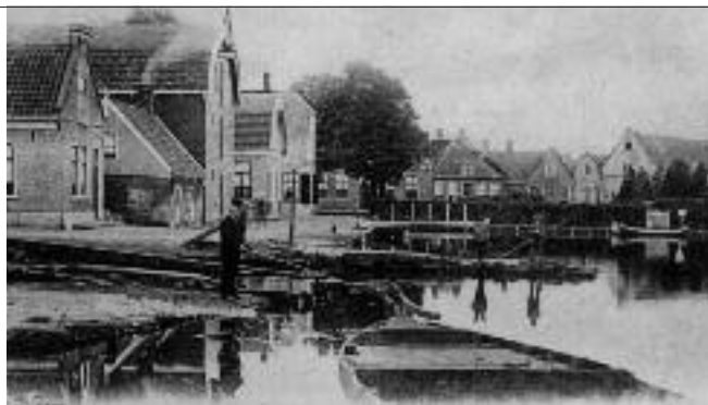
Mennonietenbuurt rond 1904. Uiterst rechts de in 1805 gestichte en in 1941 afgebroken joodse synagoge.