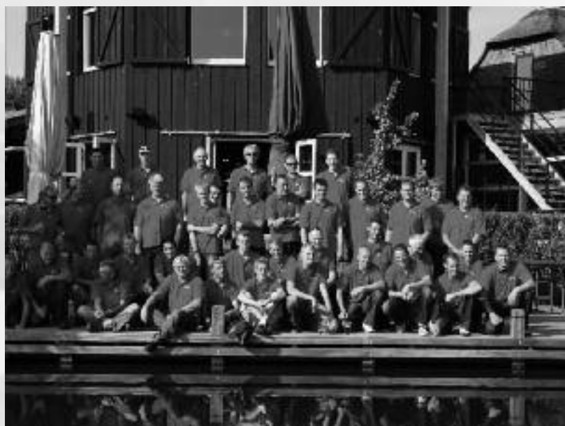
Personeel D. Kroese BV, 2011