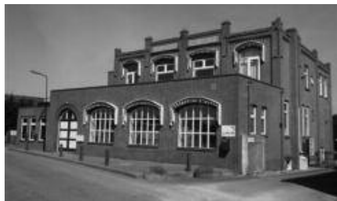
De zuivelfabriek in de Amstelhoek. Gebouwd in 1918. Staat op de gemeentelijke monumentenlijst.