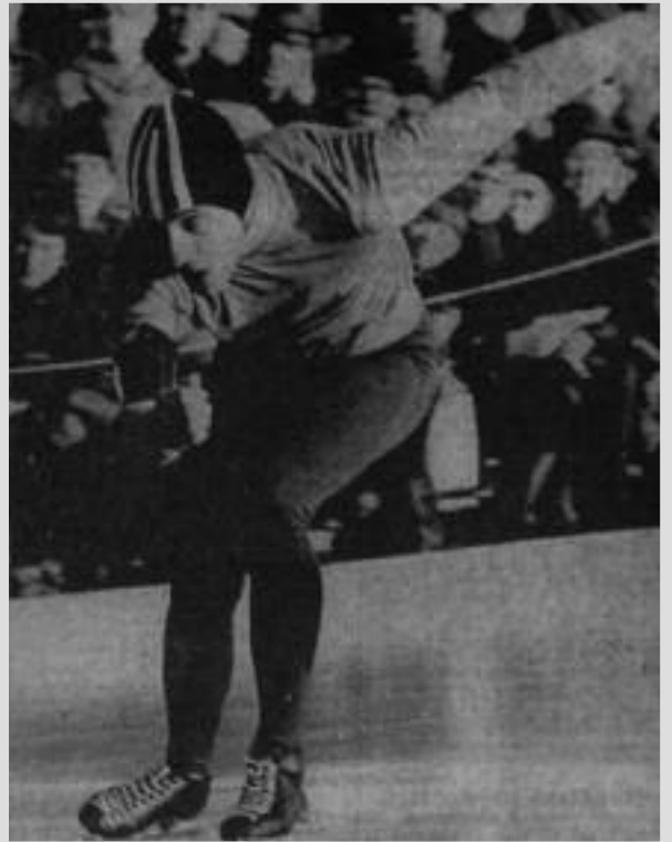
Wereldkampioenschappen schaatsen in Oslo.

Slechts beperkt aantal bezoekers mogelijk, daarom inschrijving verplicht; dit kan door € 2,- of € 4,- te storten op rekening NL75RAB0036.96.50.573, t.n.v. M.J. van Eijk. Toegangspreis € 2,- voor leden, € 4,- voor niet leden (koffie/ thee met koek inbegrepen)