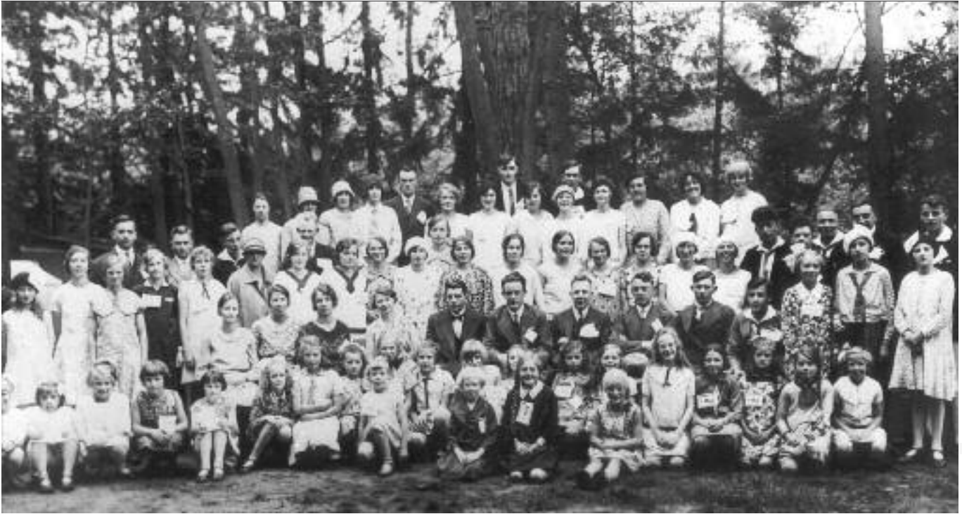
1928 - De groei zet door

25 gulden wil vangen. Hem halen en brengen kost elke keer ook nog eens drie gulden. Alles opgeteld, veel meer dan wij kunnen opbrengen. We zullen hem wel vragen zijn eisen wat te matigen en wat meer afwisseling in de stukken te brengen. Even later blijkt de Oranjevereniging KNA gevraagd te hebben om bij het koningsfeest in de muziektent een paar liederen te zingen. Helaas, het koor heeft nog nooit vaderlandse liederen ingestudeerd en gelet op de korte voorbereidingstijd wordt besloten voor deze uitnodiging te bedanken. Wat meespeelt is dat die muziektent erg dicht bij het gereformeerde kerkgebouw staat. Binnenshuis een artistiek concert geven is minder opvallend en zal beter lukken.