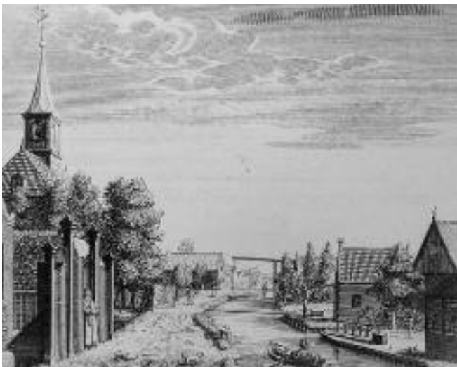
Zicht op Waverveen

In en op de bodem kun je pijpenkoppen, pijpenstelen en allerlei scherven vinden. De schepen die met turven naar Amsterdam varen, komen terug met afval uit de grote stad. Dit afval wordt gebruikt als toemaakdek. Ze mengen het met de bagger uit de sloten en stalmest om hiermee het inklinkende land op te hogen en als grondverbeteraar. In dit afval bevinden zich ook scherven en kapotte pijpen. En deze zijn nog steeds te vinden, bijvoorbeeld in molshopen en op het pad langs de Bijleveld.