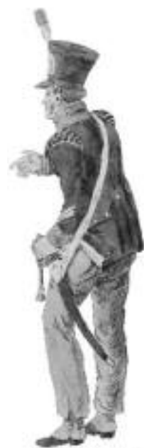
Korporaaf Nationale Militie

Kwartierstaten, een zeer uitgebreide bronvermelding met verwijzingen naar vele sites, boeken en tijdschriften als ook de genealogische familiegeschiedenis completeren het geheel van deze wel bijzonder waardevolle familie-website.