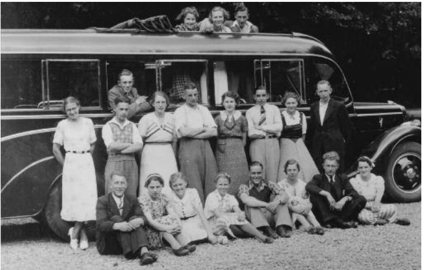
Dagje uit met de zang - ± 1939