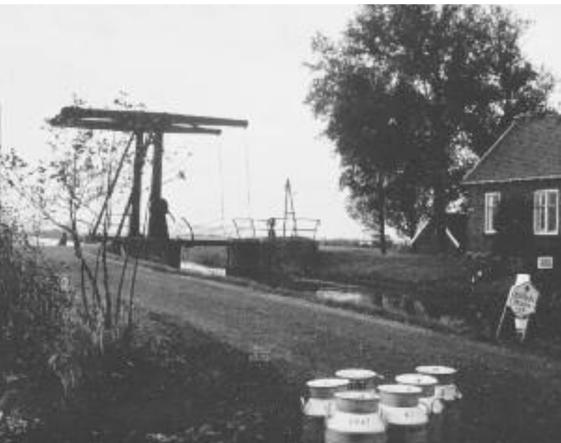
Brug over de Heinoomsvaart van de Wilnise Zuwe naar de Bovendijk

Aan de westzijde was de Bovendijk nabij het Molendland afgesloten met een landhek. Deze laatste weg was nog geen weg maar een grasdijk die door het vee van de aangrenzende boeren werden begraaft en bijna bij elk perceel aan de derde bedijking was dwars op de dijk een hek geplaatst. Ook de Amstelkade aan de westzijde van de polder was onverhard en bijna onbegaanbaar. Dus door de brug naar de Bovendijk op te halen tijdens de dropping was het gebied onbereikbaar. Midden door dit stuk bovenland liep en loopt de Veldwetering die een belangrijke rol vervulde na de dropping. Dit ter inleiding en om aan te geven hoe de plaatselijke situatie in de laatste oorlogsjaren was.