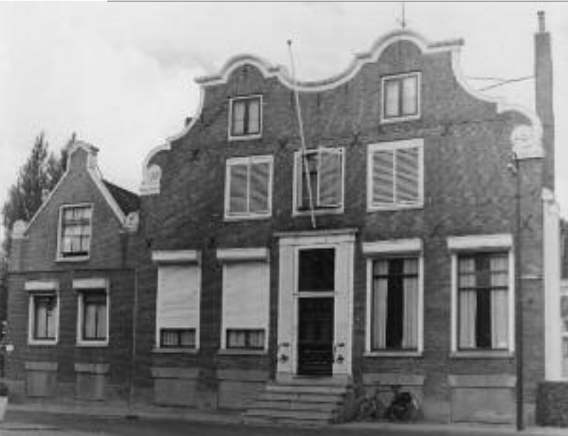
De woning met daarnaast nog het aangrenzende pand en één van de bomen van de oorspronkelijke tuin.