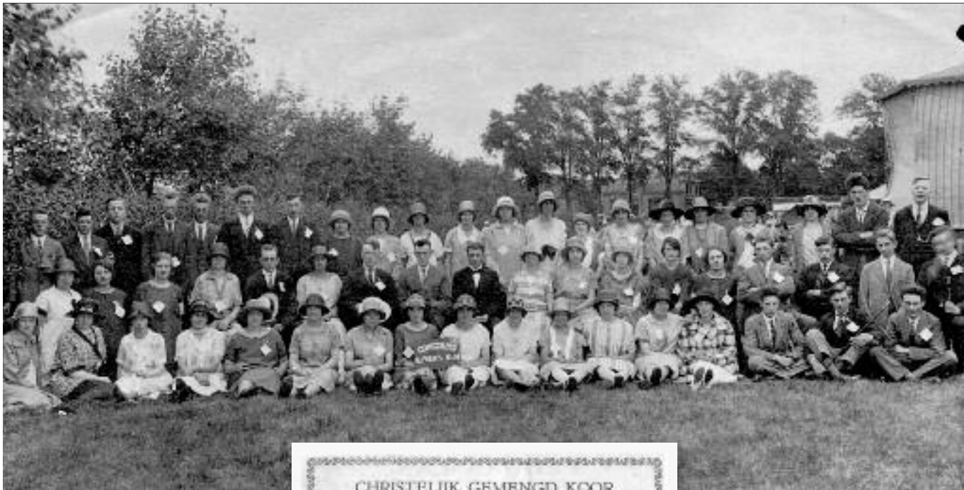
Concours Alphen aan de Rijn