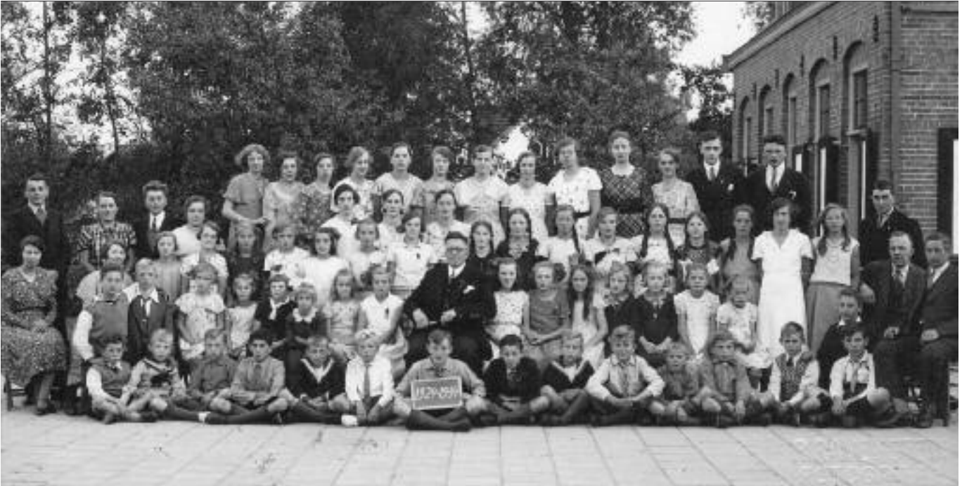
Tienjarig bestaan van KNA in 1934 met het kinderkoor

“We zijn maar een boerendorpje en hoeven niet op de Amsterdamse manier concerten te geven met bijv. een declamator.”