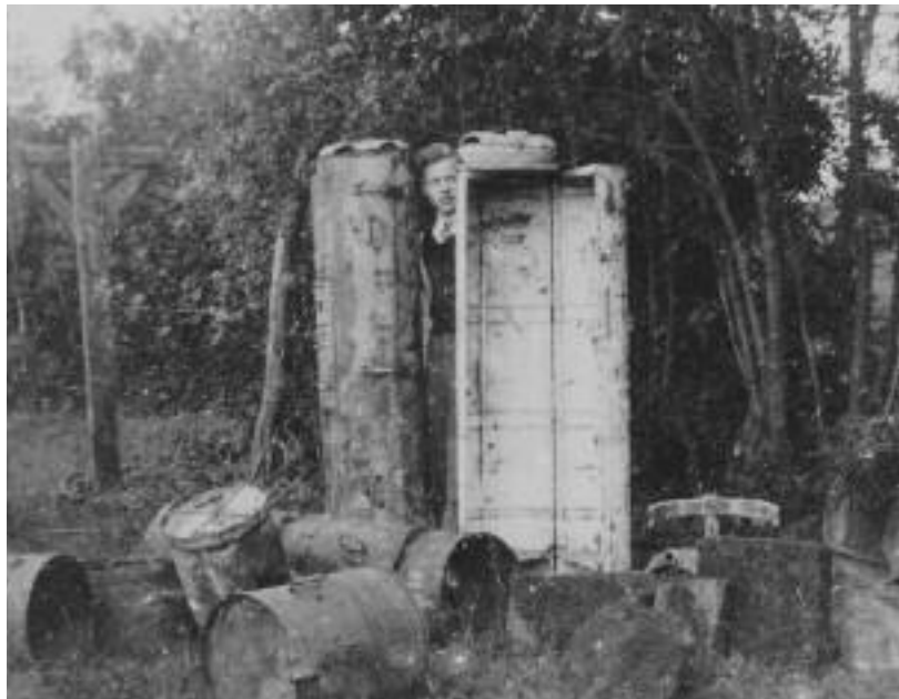
Verschillende containers gebruikt bij de droppingen