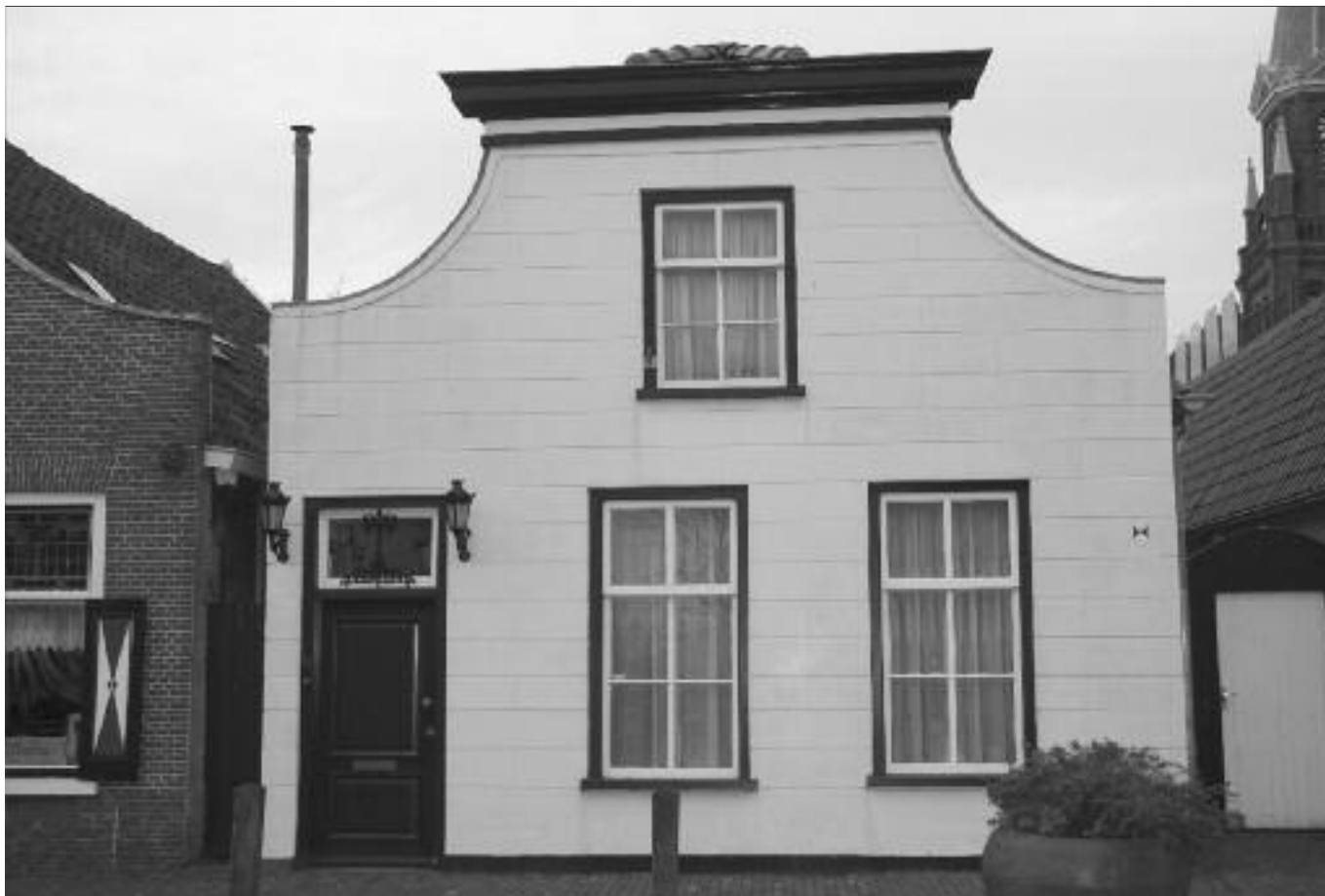
Gemeentelijk monument, Dorpsstraat 61 Wilnis. Dit woonhuis werd in 1873 gebouwd in opdracht van metselaar L. Vlasman