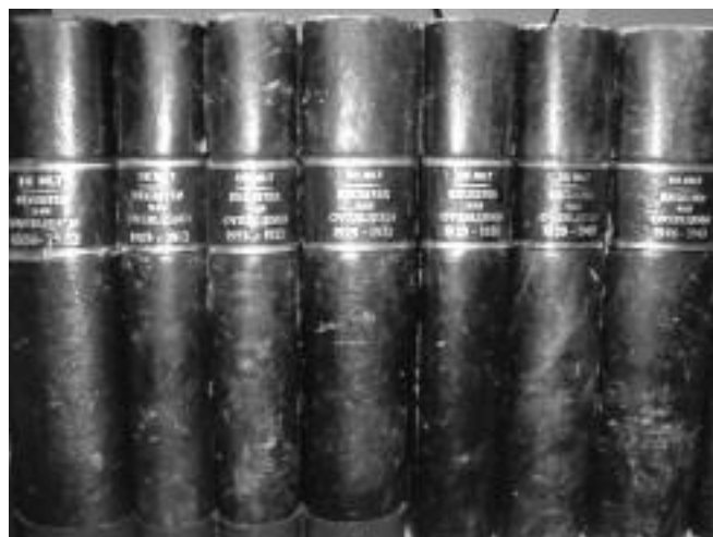
foto: collectie RHC Vecht en Venen, boeken van de burgerlijke stand

Als u onderzoek doet naar de historie van De Ronde Venen, is het RHC zeker een bezoekje waard. Verder kunt u hier terecht voor uw stamboomonderzoek, maar ook voor oude bouwtekeningen. Als uw huis, of een ander gebouw, na 1903 is gebouwd of verbouwd is er kans dat