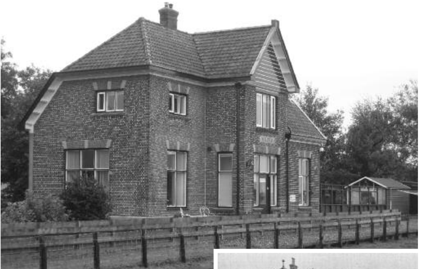
Gemeentelijk monument, Ir. Enschedeweg 14 Wilnis.

Dit voormalige station gelegen langs het traject Uithoorn - Nieuwersluis werd op 1 december 1915 officieel geopend