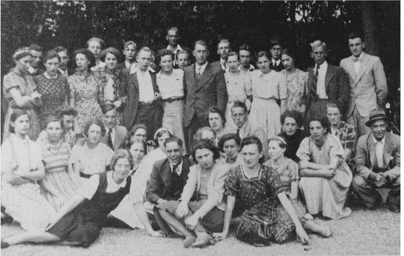
Dagje uit met de zang - ± 1938