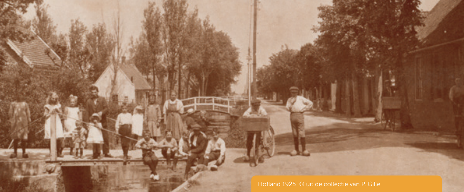
Hofland 1925 © uit de collectie van P. Gille