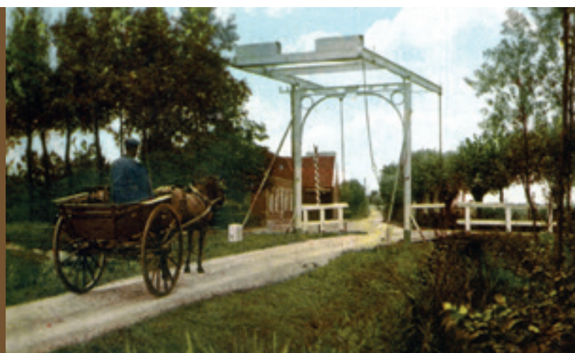
foto linksboven: "Een kiekje te Vinkeveen"