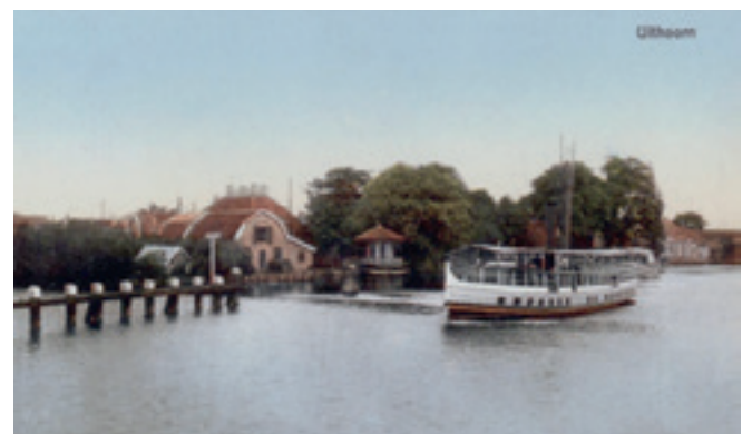
De Volharding vertrekt uit Uithoorn

In Uithoorn begon het, een drama, dan zat je in de boot 'De Volharding'. Dat was heel klein. Zo'n trapje ging naar beneden, mooie koperen treden. Beneden was een hele grote tafel en de vrouwen zaten daar te breien en de mannen te kaarten of zo. Ik had liever limonade of chocolademelk. Dat was een gebeurtenis. ■