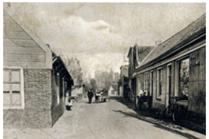
De Heul richting Herenweg

ELKE WEEK WERDEN ER IN VINKEVEEN ONGEVEER EEN HALVE KOE, DRIE SCHAPEN EN ZES VARKENS OPGEGETEN