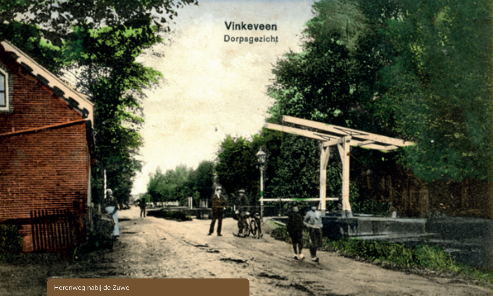
Herenweg nabij de Zuwe

varkens, welke jaarlijks worden geslacht. Tot na ca. 1950 was het gebruikelijk dat Vinkeveners in de achtertuin een varkenskot hadden. Alle restante eetwaar, alles wat overbleef aan tuinafval ging richting het varken en in oktober, jawel de slachtmaand, kwam de knors, de vrije slachter, en deze 'leerde' het varken nog na de dood van het beest. Het varken werd na de slachting opgehangen aan een ladder, ook wel in het volksdialect een "leer" genoemd.