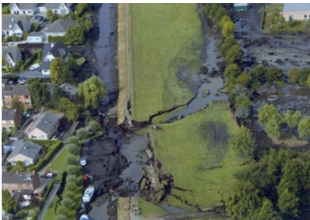
Dijkdoorbraak in Wilnis 2003

Sinds 26 augustus 2003 is het begrip veendijk algemeen bekend in De Ronde Venen. Een veendijk is eigenlijk geen dijk, maar een restant bovenland dat fungeert als een ringdijk om een droogmakerij. Bij Wilnis verschoof in 2003 een deel van zo'n veendijk. Nu zijn inmiddels alle veendijken versterkt met klei.