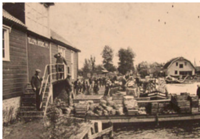
Veilinggebouw te Vinkeveen

van turven en het baggeren van het veen worden speciale schepen ontworpen: bokken en pramen. Dit zijn platte, brede boten die weinig diepgang hebben. Ideaal voor de ondiepe wateren. Ook voor het vervoeren van de melkbussen en het riet uit Botshol worden bokken en pramen gebruikt. En het transport van groenten en fruit naar de veiling in Vinkeveen gaat uiteraard ook met deze vervoersmiddelen.