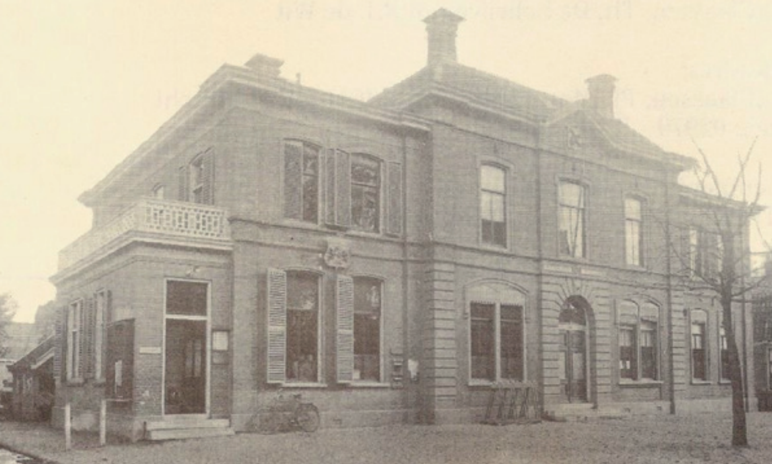
Het gemeentehuis van Mijdrecht, omstreeks 1945. Rechts beneden bevond zich de kamer van de burgemeester. Hier hingen de ingelijste portretten van Adolf Hitler en Anton Mussert.

voorgehouden dat zij wel eens naar Duitsland konden worden gedeporteerd. Op de dag van zijn installatie, op 6 november 1943, wapperde op zijn bevel de vlag van de NSB in de toren van het Hervormde kerkgebouw en werd er een afbeelding van Hitler en Mussert in de burgemeesterskamer opgehangen.