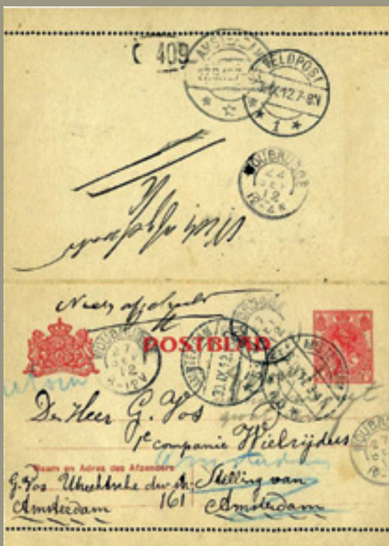
boven: postblad uit verzameling J.P.G. van der Meer onder: briefkaart uit verzameling J.P.G. van der Meer

Een korte tijd was Mijdrecht met het tijdelijke veldpostkantoor het centrum van een oorlog. Ook al betrof het hier een oefening. ■