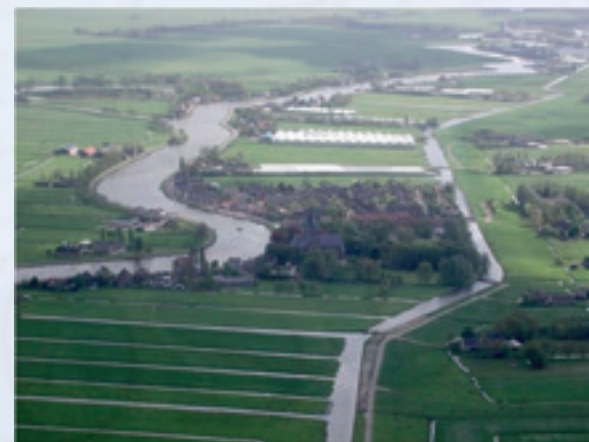
De Amstel vanuit het Noorden, met Nes a.d. Amstel en op de achtergrond Uithoorn

Na de pauze volgt de lezing van de heer Ton Smit over de Amstel