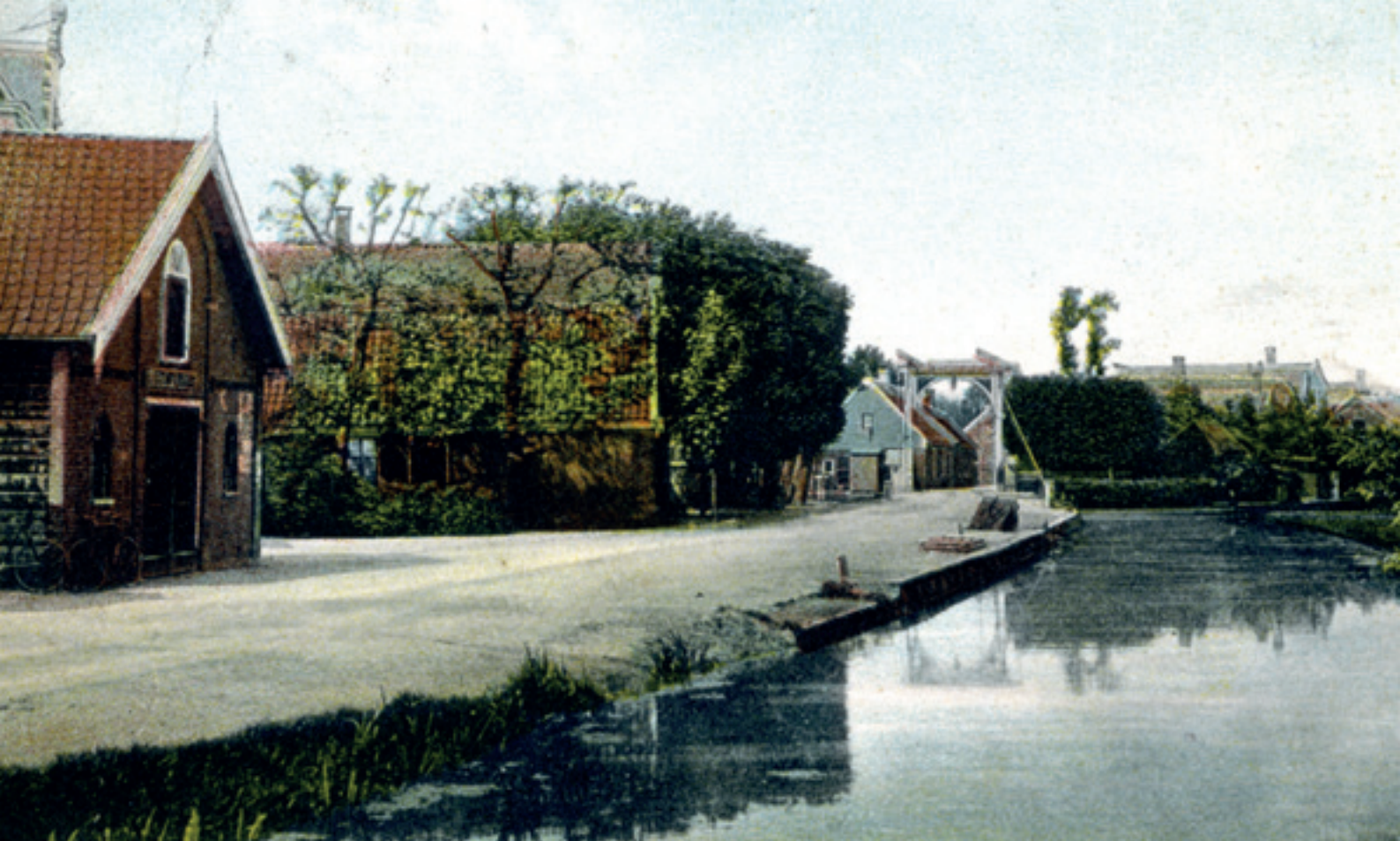
Demmerik met zicht op de Heul

Helaas zijn in de archieven de notulen van de eerste vergadering van de raad niet bewaard gebleven om ons een indruk te geven van de eerste bestuursdag na de vestiging van een bevrijd Koninkrijk der Nederlanden. Het oudste verslag van de vergadering van de Raad der Gemeente Vinkeveen dateert van 16 mei 1821. (RHC Breukelen)