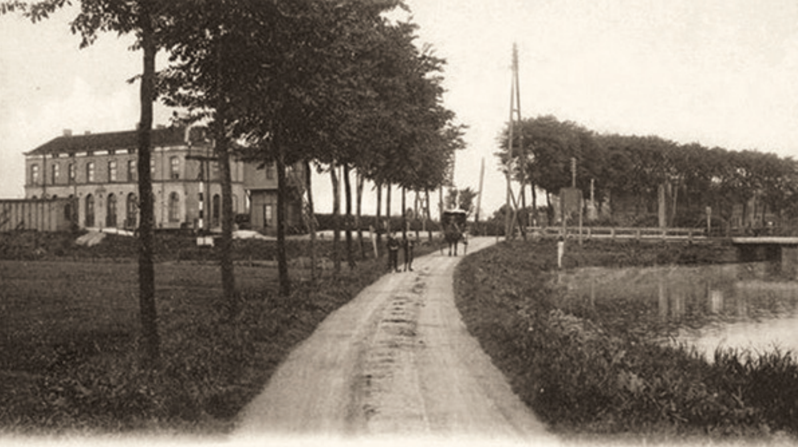
UITG. NAUTA, VELSEN. 3773.