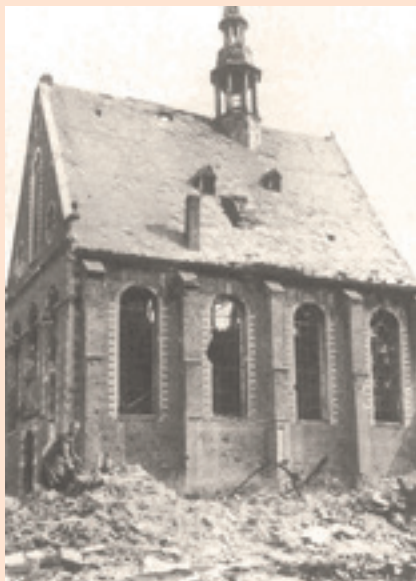
Gennep 1944, beeld van de kerk

Enkele inwoners van Gennep, die destijds in Mijdrecht onderdak hebben gekregen kijken in 1998 terug op de hongerwinter in Mijdrecht, het vele water, het schaatsen en vooral het plezier en het avontuur dat ze als kind hadden met de kinderen van de boeren uit de omgeving waar ze waren gehuisvest.