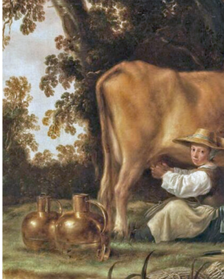
Detail van 'de melkster' van Albert Cuyp

Deze was toen en is nog steeds onlosmakelijk verbonden met het schoonmaken van het daarbij gebruikte gereedschap. Aan de Nessersluis was er al opmerkelijk vroeg leidingwater en dat hield verband met de melkfabriek van de reeds vermelde Theo Nieuwendijk. Maar in 1914 draaide het bij het schoonmaken nog om het water uit de sloot die langs - en ook vaak tot in - het zogenaamde boenhok liep. In dat hok of buiten, op de stoep, werden dan de teems (2) en de melkammers gereinigd. Hulpmiddelen daarbij: schuurzand en soda. De boenhokken waren vaak met een schoorsteen getooid. Dat had te maken met het (hout-)fornuis, waarmee het (sloot-)water werd verwarmd, teneinde het schoonmaken te vergemakkelijken: de werkzaamheid van soda in koud water is bescheiden. Het verwarmde sodawater werd met name losgelaten op houten melkammers. Deze hadden als nadeel, dat ze lang niet altijd tegen een trap van een koeienpoot bestand bleken: daar sijpelde dan tergend langzaam maar wel heel zeker je dampend verse melk het gras in... Maar ook metalen emmers kenden een eeuw geleden een belangrijk nadeel: roestvorming. Weliswaar werd er toen al verzinkt ijzer gebruikt, maar dat zinken laagje liet zich toen nog makkelijk met zand wegschuren. De toepassing van het destijds nog uiterst moeilijk en