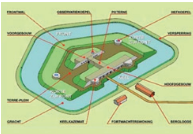
Tekening Lex Tempelman

Na diverse discussies werd besloten om te kiezen voor een fort met een lunet, een klein vestingwerk met twee schuine, naar buiten gerichte zijden (facen genoemd) en twee naar achter gerichte zijden (flanken) waarbij de keel open is of op eenvoudige wijze afgesloten door een borstwering of een muur met schietgaten omringd door een gracht, voorzien van een bakstenen kazerne met daarin een pantserkoepel. Hoewel de bouw van de forten met verve aangepakt werd, was niet alles gereed bij het uitbreken van de oorlog in 1914.