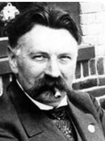
Schrijver Theo Thijssen.

Het werd al gauw duidelijk dat er problemen zouden komen met de aanvoer van levensmiddelen uit