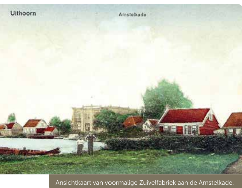
Ansichtkaart van voormalige Zuivelfabriek aan de Amstelkade.

“De melkveeouders geven hun verzet tegen de melkcentrale niet op. Hedenmorgen werd een melkboot met 3000L. melk uit Mijdrecht (dus van de VAMI-fabriek aan de Amstel, SV) door een 30-tal met geweren gewapende melkveeouders aangehouden. Bij ‘Het Kalfje’ werd de vervoerder van de boot gedwongen terug te keren en toen hieraan niet direct voldaan werd,