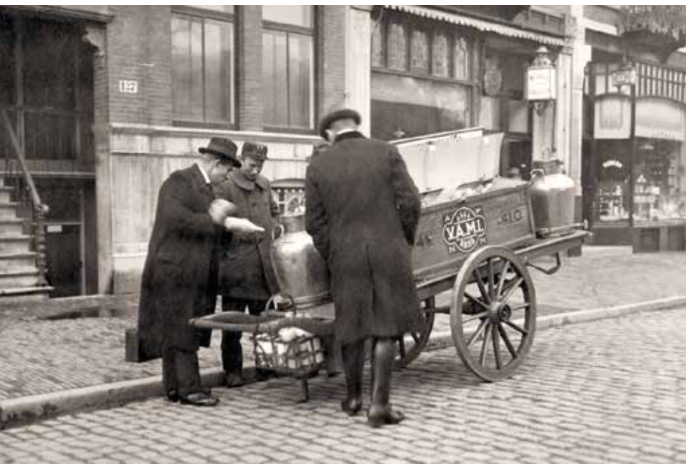
Aan de kwaliteit van melk werden hoge eisen gesteld (voormalige collectie V.A.M.I. Amsterdam).