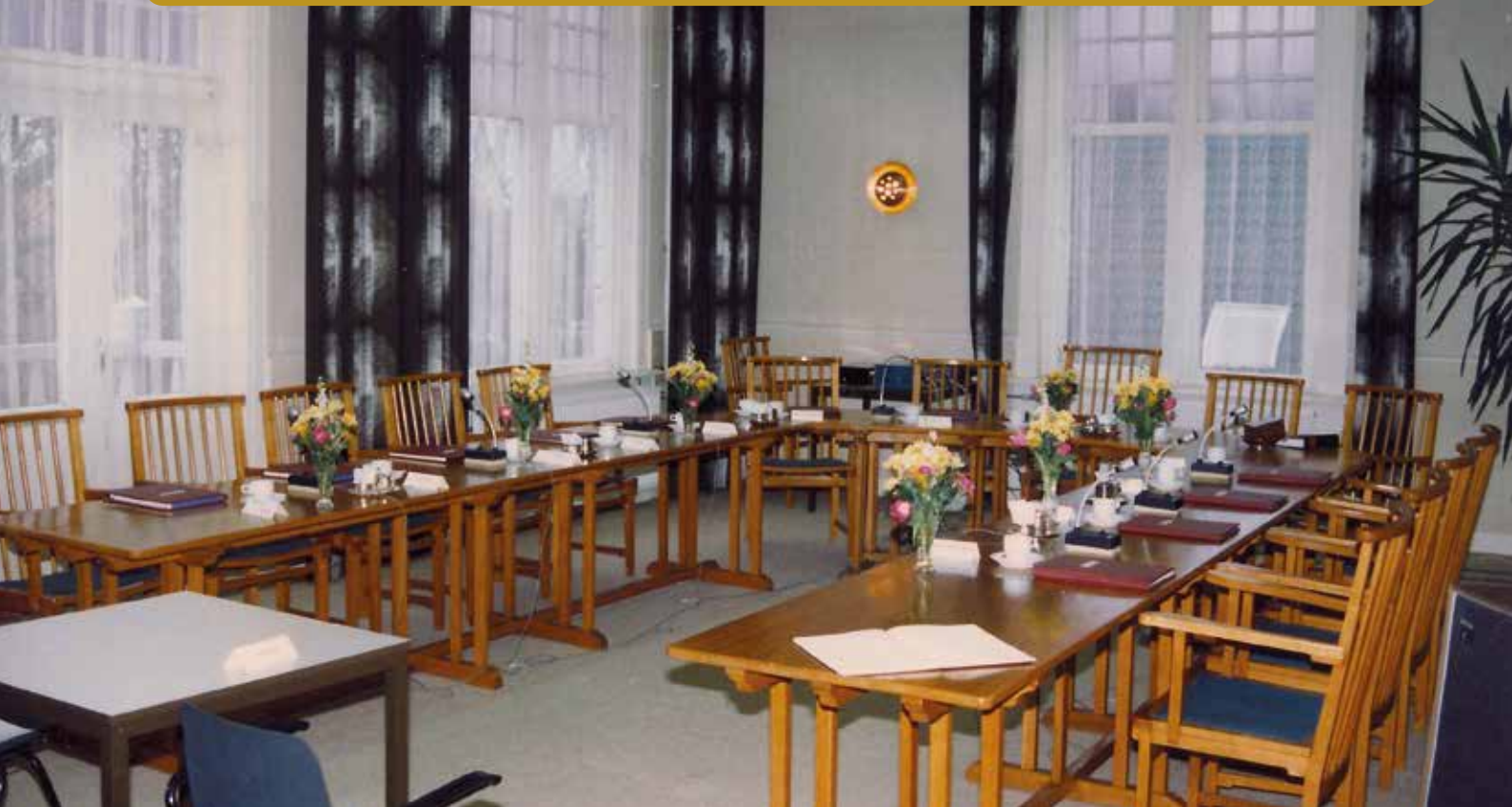
De raadzaal op de eerste verdieping van het raadhuis, de nieuwe werkplek van de ontvanger.

DE SFEER IN HET GEMEENTEHUIS WAS MEDE DAARDOOR SOMS OM TE SNIJDEN.