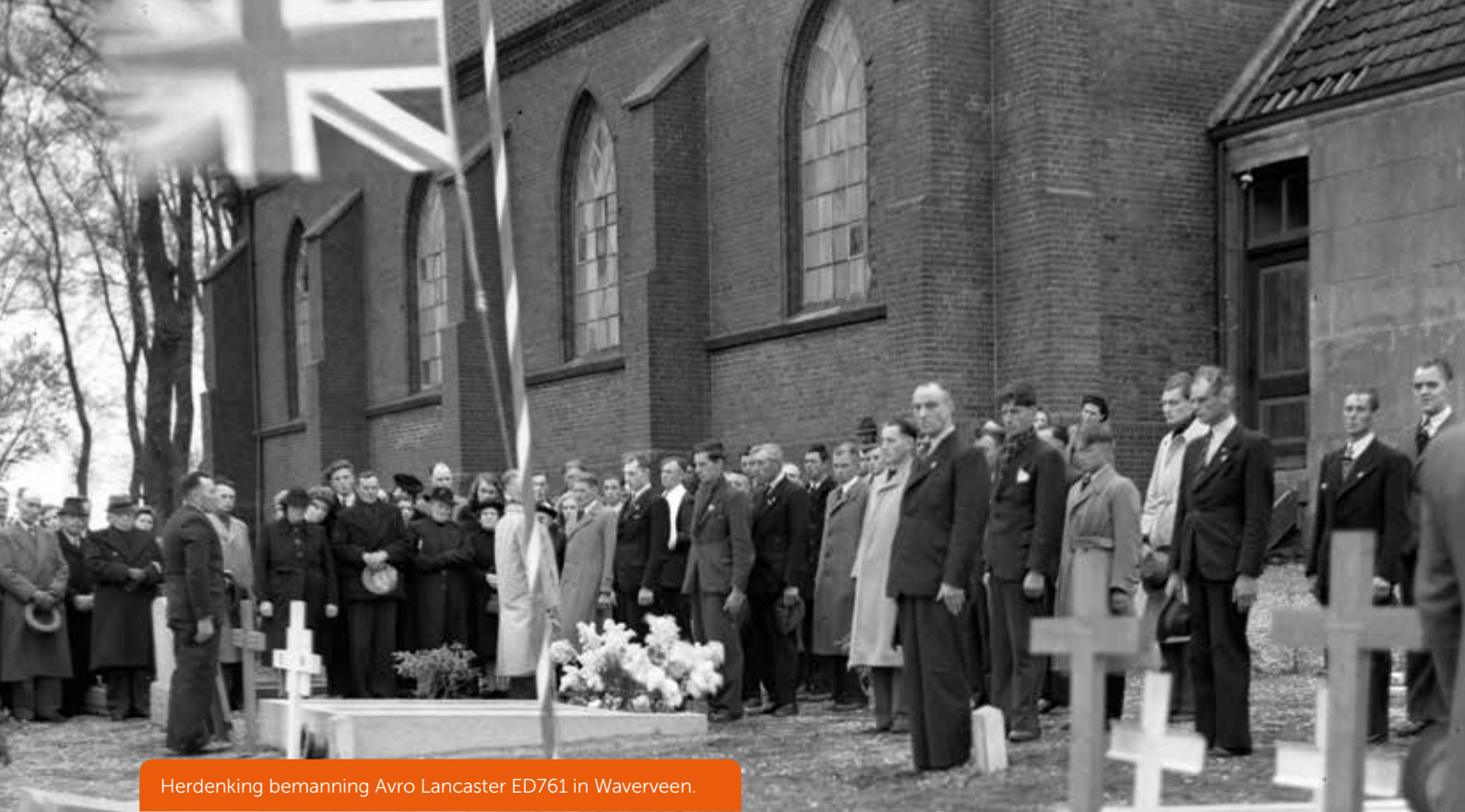
Herdenking bemanning Avro Lancaster ED761 in Waverveen.