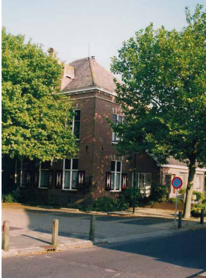
Het raadhuis in ca. 1982.

De voorzitter meent dat de zaak niet ernstiger moet worden gezien dan zij is. De raadsleden weten allen