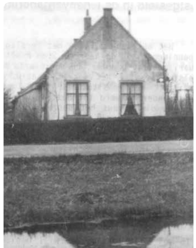
Ziekenhuis van Mijdrecht.

In 1915 werd er in Mijdrecht de ziekte tyfus geconstateerd. Waarschijnlijk is de uitbraak van deze ziekte ontstaan door contact met de militairen van het fort in Amstelhoek, omdat daar eveneens een geval van tyfus zou zijn geconstateerd. De patiënten werden opgevangen in het gemeentelijk ziekenhuis dat zich bevond op Hofland, ter hoogte van het huidige pand 184. Dit ziekenhuis heeft van 1874 tot 1919 dienst gedaan en werd gebruikt om in twee kamers lijdende van besmettelijke ziekten te isoleren. De inventaris was erbarmelijk en bestond uit twee ijzeren ledikanten, tien stromatrasen en twee zeegrasbedden. De patiënten hadden verder de beschikking over een theepot en een leetje met drie griffels. Verder waren er maar twee kammen en twee tandenborstels. Geen wonder dat het ziekenhuis meestal leeg was en dat men er alles voor over had om de zieken thuis te verzorgen. Er waren twee verzorgers voor de zieken die beiden nog een ander beroep hadden.