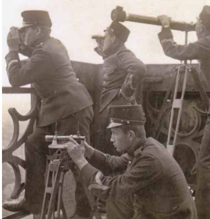
Oefening op de Domtoren tijdens de mobilisatie, 1914.

van Dishoeck, waarin hij noteerde hoe het er in het fort aan toeging. Hij schreef onder andere: "Wat het werk betreft is het fort zowat gereed, en nu komt eigenlijk de beroerdste tijd. Er is niets te doen dan wachten. Af en toe een militaire wandeling, maar weldra zijn we uitgewandeld. Voor ons artilleristen is oefenen met kanonnen ook niet langer dan vijf minuten uit te houden, omdat de behandeling van het moderne geschut