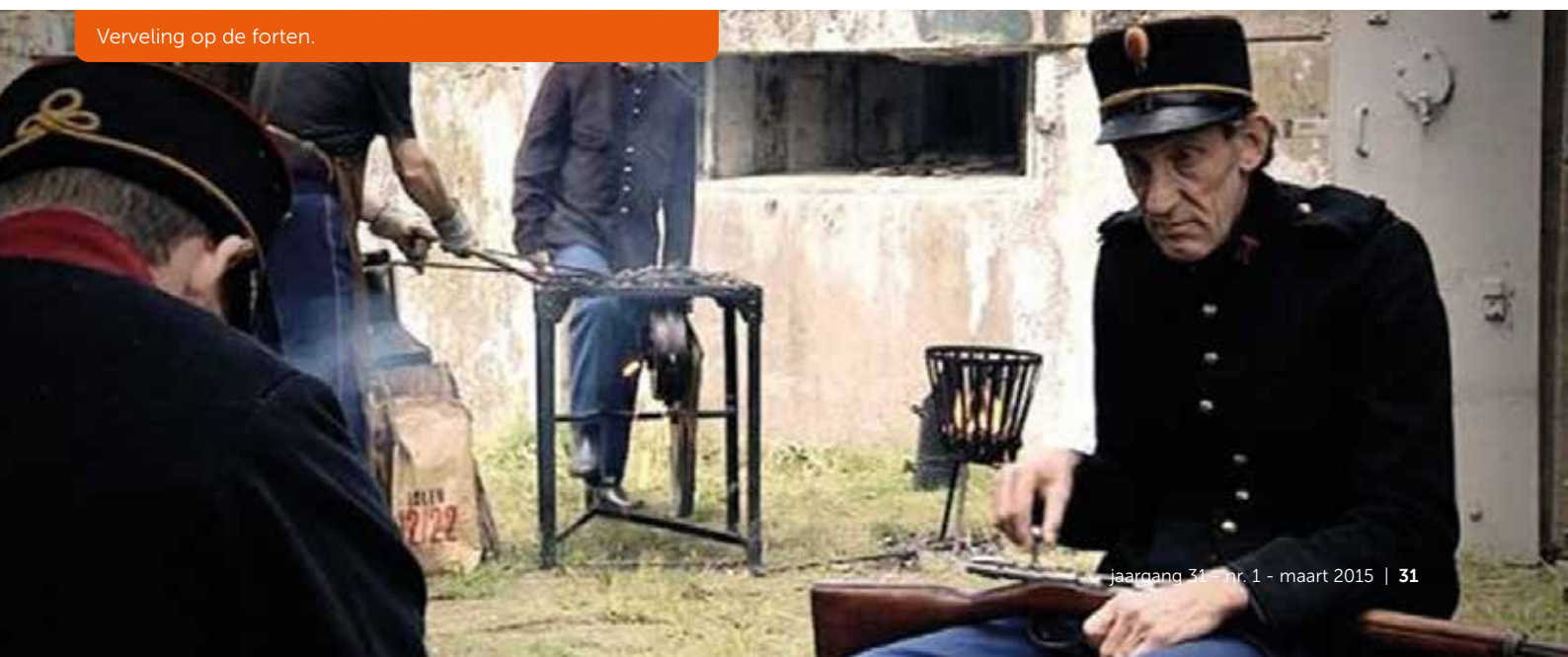
Verveling op de forten.

In de raadsvergadering van 18 februari 1915 kwam de distributie van de levensmiddelen opnieuw aan de orde en er werd medegedeeld dat de gemeente van de provincie goedkeuring had gekregen voor de aankoop van f. 6.000,- aan tarwe en rogge en goedkeuring voor de aankoop van andere levensmiddelen ter waarde van f. 2.000,-. Het besluit om de rogge alleen te gebruiken voor de inwoners van Mijdrecht is door het provinciaal bestuur afgekeurd, omdat er te weinig rogge beschikbaar was.