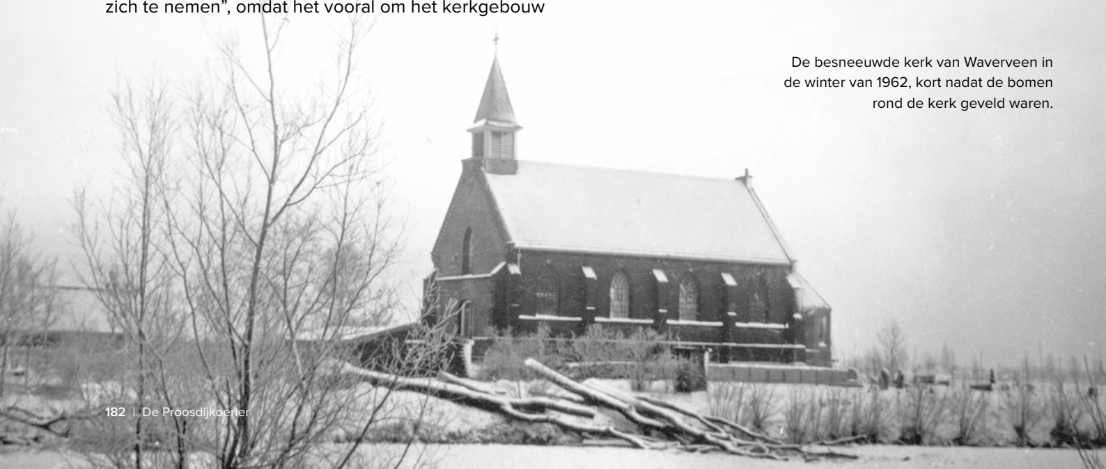
De besneeuwde kerk van Waverveen in de winter van 1962, kort nadat de bomen rond de kerk geveld waren.

Levensschets’ wordt weliswaar lovend gemeld dat de Waverveense gemeente daar nooit onder geleden heeft, de notulenboeken geven toch een iets andere indruk. Zo werd door een kerkvoogd in het voorjaar van 1957 opgemerkt “dat de gang van zaken in verband met de Hongaarse vluchtelingen niet naar wens gaat”: “Het gemeentewerk stagneert en de dominé is bijna niet meer in de gemeente.”