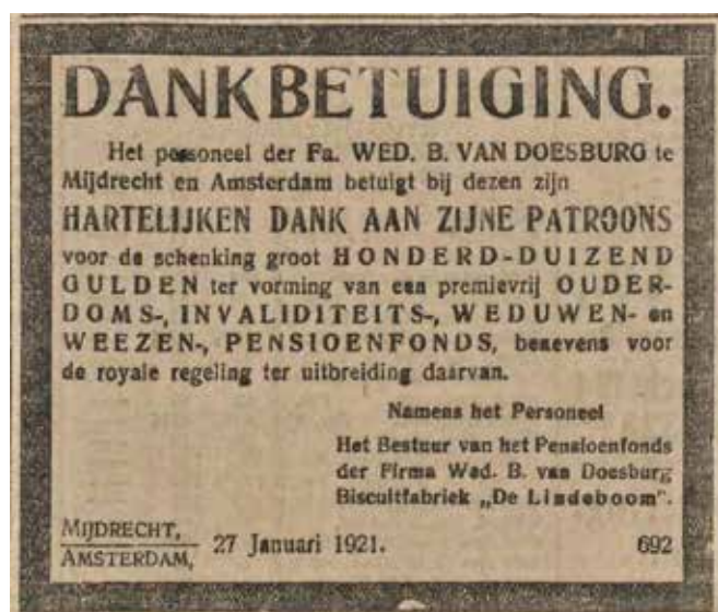
Pensioenfonds - Dagblad De Tijd van 27 januari 1921 - bron Delpher.

Maar ook de personeelswinkel van 'De Lindeboom' bood wel eens mogelijkheden. De letters 'ISLOK' op de etalageruit stonden voor 'In Samenwerking Ligt Onze Kracht'. Van tijd tot tijd kon het personeel in de winkel terecht voor een maaltje vlees. Dat was afkomstig van eigen vee, vetgemest met korstafval uit de fabriek. Betrokkenheid die dankbaar tot uitdrukking werd gebracht.