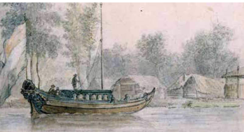
1672 - Gezicht op kwartier van Prins Willem in Bodegraven Valentijn Klotz, Rijksmuseum Amsterdam.

Toen bij Bodegraven, waar het hoofdkwartier van de prins gevestigd was, de situatie kritiek werd, kreeg kolonel Palm opdracht de post Uithoorn te verlaten en de uitleggers lek te stoten 8 .