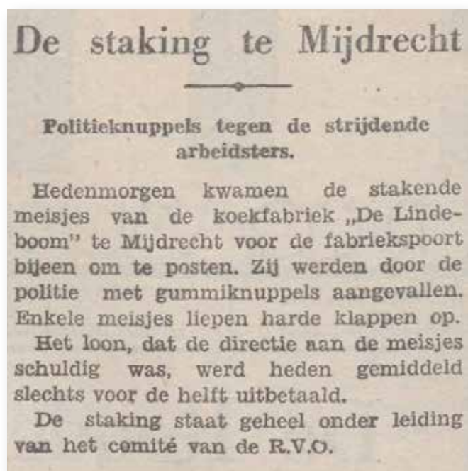
Staking in Mijdrecht - De Tribune 10-08-1931