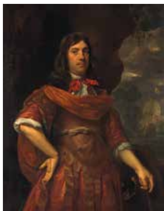
Links: 1668 - Cornelis Tromp door Jan Mijtens, Rijksmuseum Amsterdam.

te sullen leven'. 9 Op 28 mei kwam luitenant-admiraal Cornelis Tromp met zes schepen vanuit Amsterdam aan bij de vloot van De Ruyter. Uit eerbied liet Tromp zijn schip achter dat van De Ruyter om varen. De twee man-