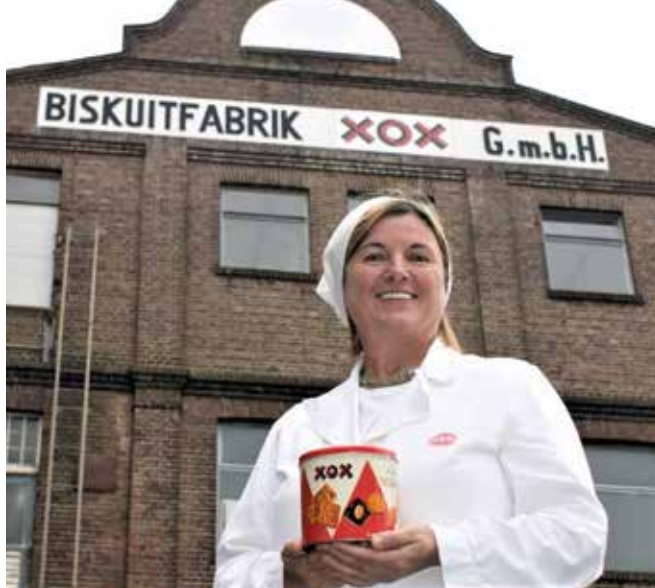
De voormalige XOX fabriek sloot haar deuren in 1977.

Een dag later lag er een brief op de gemeentelijke deurmat. De directie beklagde zich over de inhoud van het krantenartikel. In de vergadering van 30 december werd de gemeenteraad er nader over geïnformeerd. De stilstand zou te maken hebben gehad met noodzakelijke veranderingen aan de technisch installatie. Men hekelde vooral “de vijandige geest” van het hogere gemeentepersoneel. “(...) wien het daarmee gelukt is de zaak groote schade toe te brengen.” Burgemeester Padmos liet weten dat er inmiddels een gesprek met de correspondent had plaatsgevonden en dat deze spijt had betuigd aan de directie van ‘De Lindeboom’. Ook de gemeenteraad sprak zijn afkeuring uit en vertrouwde erop dat dit in de toekomst nooit