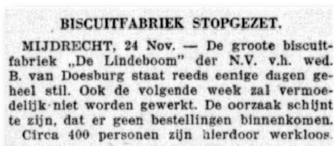
Fabriek stopgezet - De Telegraaf 25-11-1930