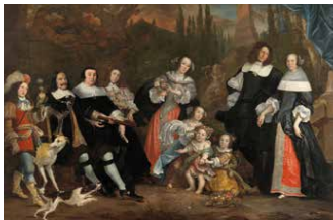
1662 - Michiel de Ruyter en zijn gezin - Jurriaen Jacobsz, Rijksmuseum Amsterdam.

de prins op en na 20 maart 1673 verbleef. De Ruyter was op 21 maart nog in Amsterdam. Mogelijk vond de eerste ontmoeting in de dagen daarna plaats. Het liep uit op een geweldige ruzie tussen de twee mannen. De