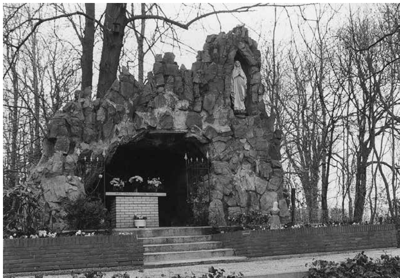
Lourdesgrot bij Zevenhoven.

De kerk in Vinkeveen is niet de enige plek in Nederland waar de verering van Maria van Lourdes een belangrijke rol speelt. Vroeger waren maar weinig mensen in staat om op bedevaart naar Lourdes te gaan. Daarom ontstonden in veel plaatsen replica's van de grot uit Lourdes. In de meeste gevallen had men niet de pretentie om er een bedevaartsoord van te maken en bleef het bij de lokale Mariaverering. Een mooi voorbeeld van een Mariagrot vinden we in Noordeinde