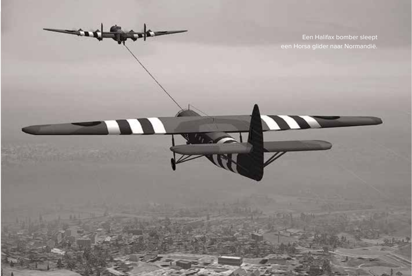
Een Halifax bomber sleept een Horsa glider naar Normandië.

zongen wellicht als uitlaatklep voor de spanning die ze allemaal voelen. Ze worden gesleept naar een hoogte van 6000 feet en naar een van tevoren vastgesteld punt aan de Franse kust. Als dat bereikt is krijgen ze vanuit de Halifax te horen dat ze nu los moeten koppelen. Het was toen 00.07 uur. Vanaf dit punt moeten de vliegers in de zwevers het zelf doen. Door de schok van het loskoppelen verstilt het gezang en sterft het geluid van de Halifax motoren langzaam weg. Die gaan nog even door naar Caen om daar, als afleidingsmanoeuvre, wat bommen neer te gooien. Ze vliegen nu op het kompas, de snelheidsmeter en een chronometer.