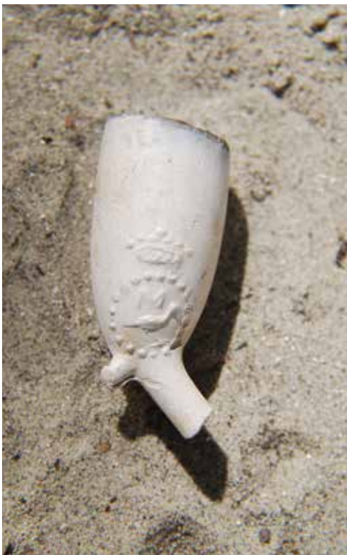
Figuur 3 en 4

Ring met wereldbol en gekroonde vis. Anoniem, naar Aegidius Sadeler, 1666. 7