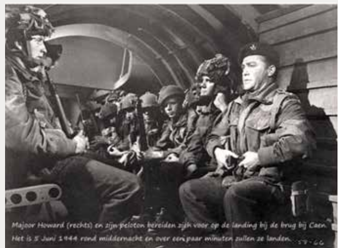
Majoor Howard (rechts) en zijn peloton bereiden zich voor op de landing bij de brug bij Caen. Het is 5 Juni 1944 rond middernacht en over een paar minuten zullen ze landen.

Inmiddels waren ook de andere twee zwevers bij de