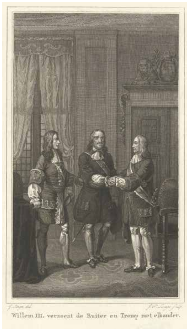
1673 - Verzoening Tromp en De Ruyter Johannes Phillipus Lange, Rijksmuseum Amsterdam.

Op 23 juni 1672 besloot de vroedschap van Amsterdam dat de brug bij Uithoorn afgebroken moest