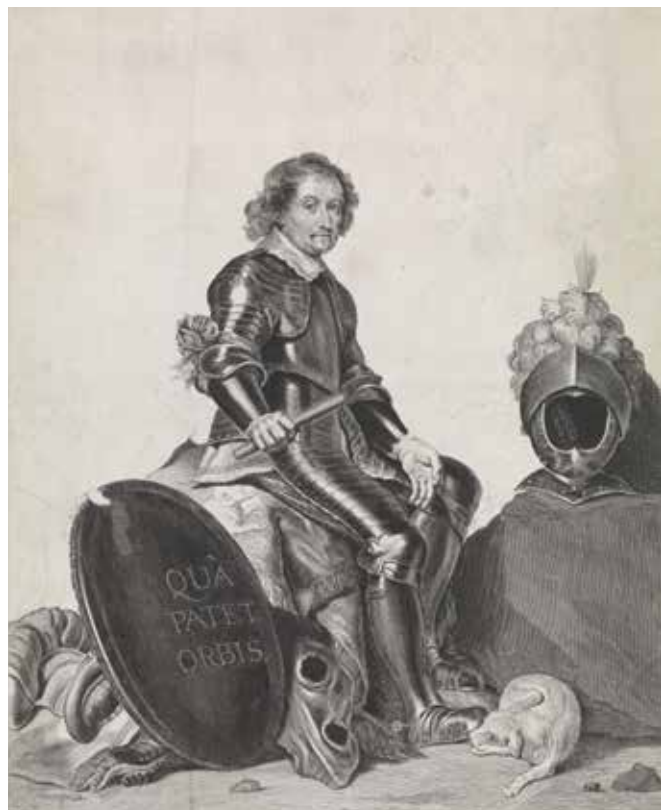
1673 - Johan Maurits - Theodor Matham, Rijksmuseum Amsterdam.

Vanaf de 23e december 1672 vrozen de Amstel en de onder water gezette velden dicht. Men vreesde een invasie van de Fransen over de rivier 6 . Kolonel Palm liet alle boeren en dorpelingen optrommelen om dit te helpen voorkomen. Met groot enthousiasme meldden zij zich om bijten in het ijs te hakken en riet af te branden 7 . De boerderij en schuren op de Proosten Bruikweer, ter hoogte van de huidige wijk Meerwijk, werden op last van Palm rond Kerstmis 1672 in brand gestoken.