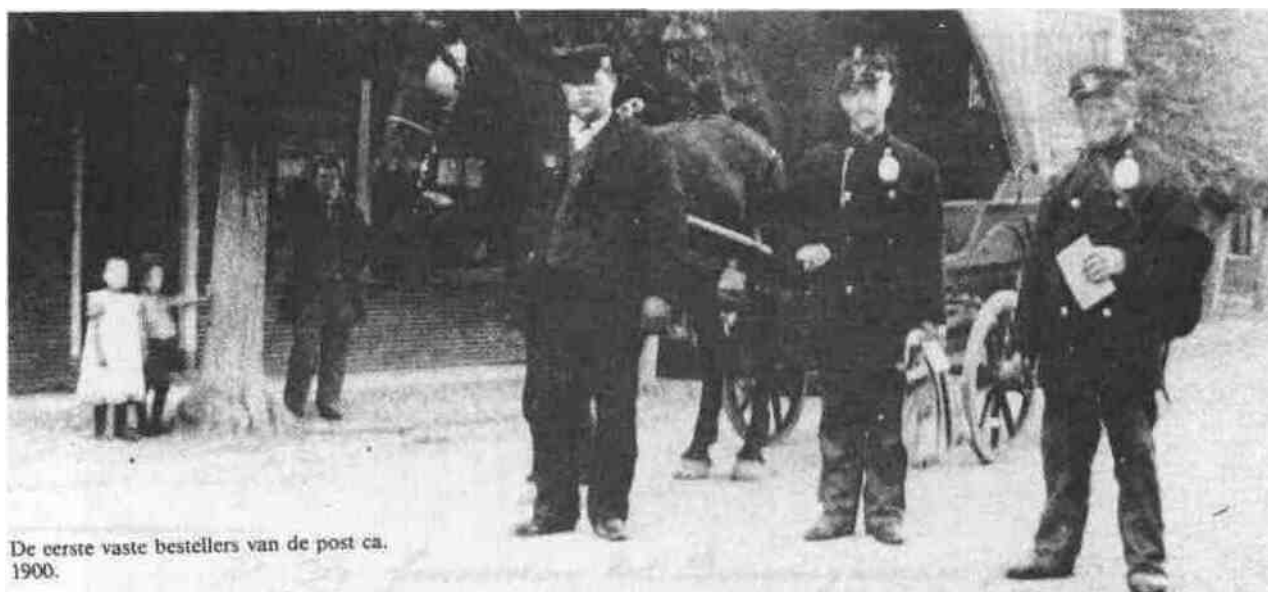
De eerste vaste bestellers van de post ca. 1900.

Een fraaie oude post-prent uit begin 1900.