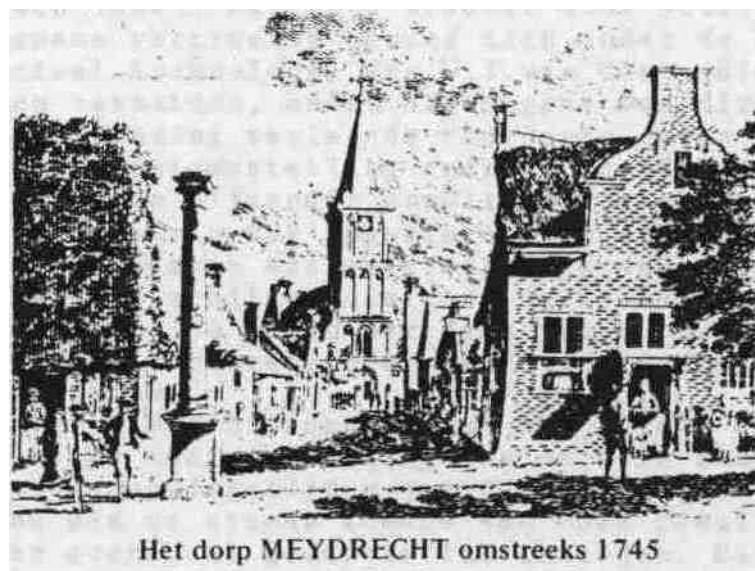
Het dorp MEYDRECHT omstreeks 1745