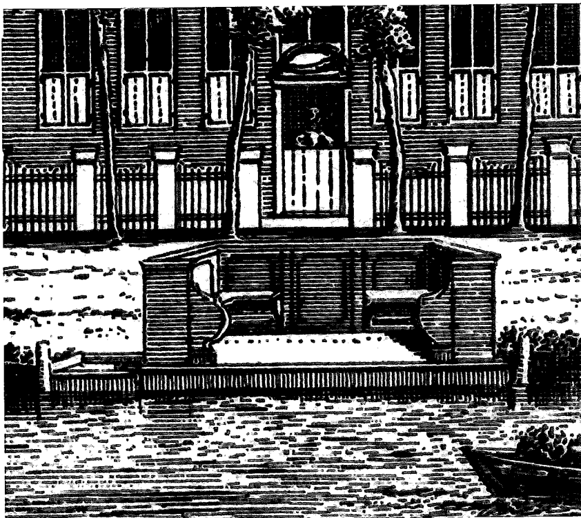
Afb. 1: De visstek van het onnozele schaepe