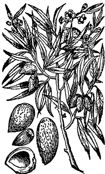
297.—ALMOND. AMYGDALUS COMMUNIS. Z. 135. Pale red, white. 20 ft. Fl., 1½ in. Mar.—Ap.