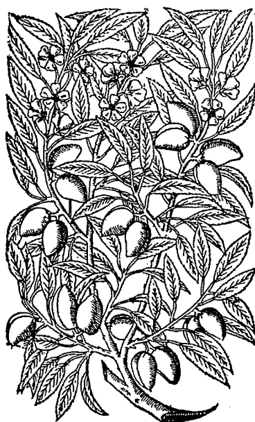
295.—ALMOND. AMYGDALUS COMMUNIS. G. 1256.