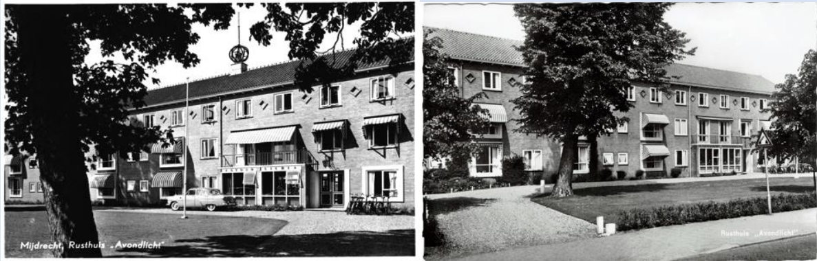
Huize Avondlicht in vroeger jaren