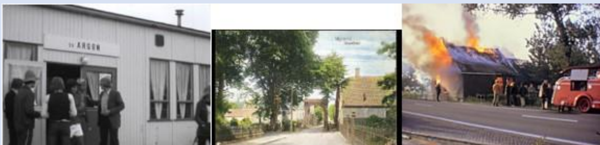
Beelden uit de nostalgische films van Mijdrecht

Kortom: er staat veel te gebeuren. Het lidmaatschap van HV De Proosdijlanden is aantrekkelijk voor eenieder met interesse in ons gezamenlijk verleden!