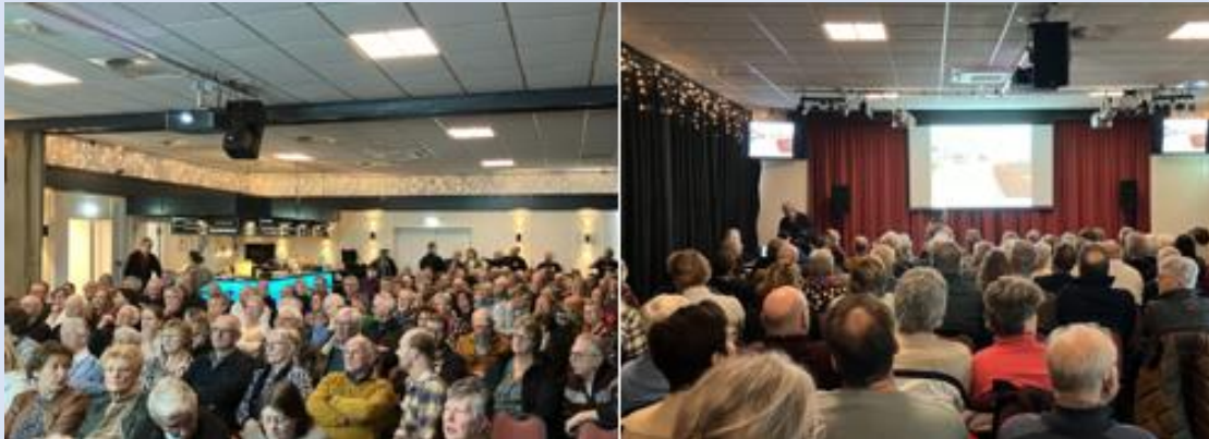
Grote belangstelling voor de films in Wilnis, het enthousiaste publiek heeft veel plezier

Op zaterdagmiddag 6 april is de voorstelling van de films over het vroegere Mijdrecht in De Rank aan de Prins Bernhardlaan 2. De voorstelling begint om 13.30 uur, de zaal is open vanaf 13.00 uur. Kaarten zijn à € 4,- te koop bij boekhandel Mondria in winkelcentrum De Lindeboom. De kaarten geven recht op toegang en een kop koffie of thee.