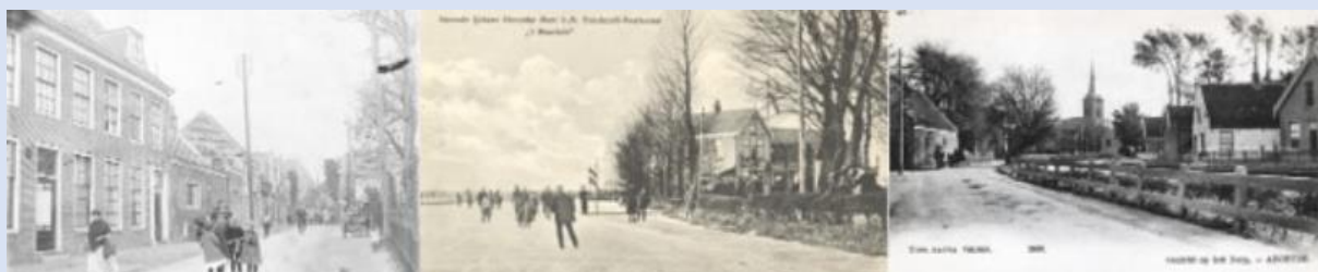
Beelden van Abcoude in de twintigste eeuw (zie ook onze website en beeldbank)

Lid worden van onze vereniging kan door uw gegevens in te vullen op onze website (scan de QR-code hiernaast en vul uw gegevens in). Of stuur een e-mailbericht met vermelding van naam en adres te naar administratie@proosdijlanden.nl . U kunt ook uw gegevens, voorzien van uw handtekening, afleveren op het bezoekadres: Croonstadlaan 4a, 3641 AL Mijdrecht. U ontvangt dan onder andere viermaal per jaar ons tijdschrift "De Proosdijkroniek".