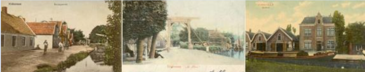
Vinkeveen vroeger, v.l.n.r.: Herenweg, Heulbrug en Demmerik (Raadhuis)

De nostalgische filmmiddag in Vinkeveen is ook dit jaar tijdens Vinkefest, In de feesttent op Demmerik staat a.s. zaterdag 18 mei een groot LED-scherm, waarop de nostalgische beelden te zien zijn. Deze keer met mooie, gedigitaliseerde beelden van een speelfilm van Fons Compier uit 1972: 'de Robot'. Ook de bouw van timmerfabriek Van Spengen aan de Baambrugse Zuwe in 1956 en we zien dat er wel degelijk paling onder de R.K.-kerk werd gevangen. De sluiting van de veiling in 1980 en andere ludieke beelden uit de jaren 50 t/m 90 komen voorbij. Kaarten hiervoor zijn verkrijgbaar bij de supermarkten Albert Heijn en Jumbo in Vinkeveen.