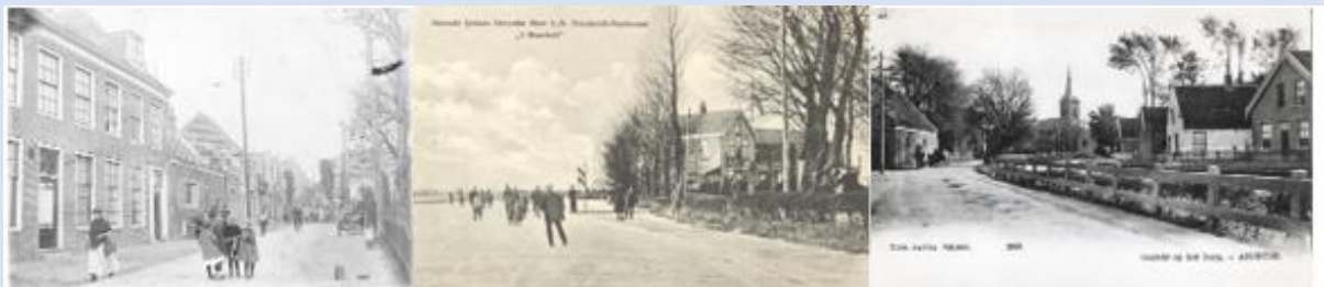
Abcoude 20 ste eeuw: de Hoogstraat, IJspret op 't Meertje en de Voordijk aan de Angstel