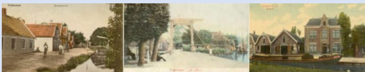
Beelden van Vinkeveen in de twintigste eeuw

Veel nostalgisch leesplezier en daarnaast aantrekkelijke, interessante activiteiten. Met andere woorden: lid zijn van HV De Proosdijlanden is alleszins aanlokkelijk en zeker de moeite waard!! Zegt het voort!