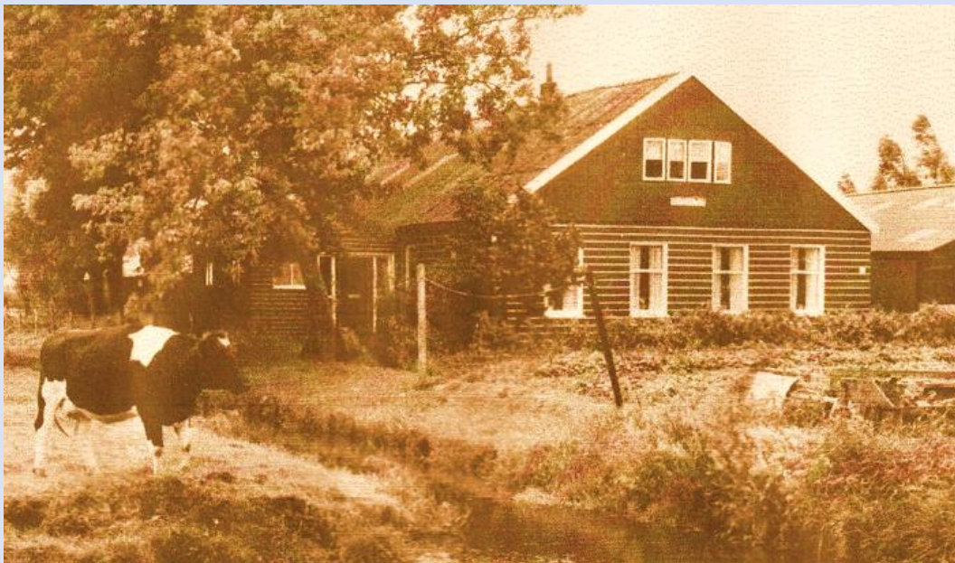
Boerderij 't Mosterdzaadje', van de familie Mosterd aan de Padmosweg in Wilnis.