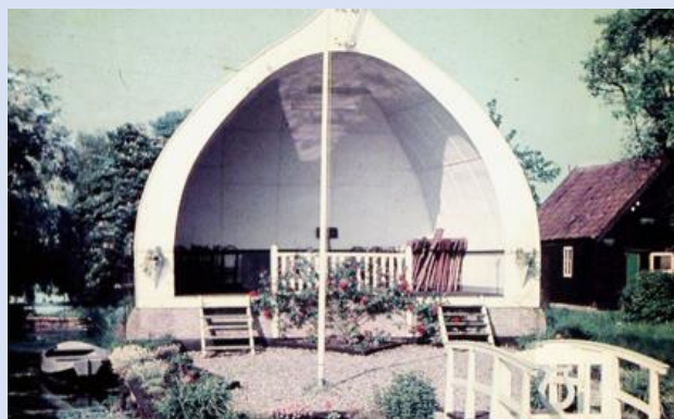
De muziekkoepeel van Concordia (foto uit de jaren zestig). (een uitgebreide terugblik op de diverse muziektenten van Vinkeveen komt in het decembern timer van onze Proosdijkroniek)

Op 18 november a.s. is een aantal leden van de projectgroep 'De Nieuwe Walnoot', in het Vinkeveense Dorpshuis aanwezig bij het maestroconcert ter gelegenheid van het 125-jarig bestaan van brassband Concordia. Bezoekers kunnen kennis nemen van de plannen om een eigentijdse muziekkoepeel te realiseren en om door het opgeven van een e-mailadres op de hoogte te worden gehouden van de voortgang van het walnootproject.